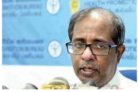
கொரோனா நோயாளிகளுடன் தொடர்புகொள்வதைத் தடுப்பதற்கான டிரையேஜ் என்ற