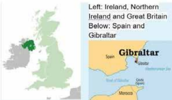
அயர்லாந்து இங்கிலாந்து, வட அயர்லாந்து

இங்கிலாந்திற்கு மேற்கே உள்ள ஒரு தீவு அயர்லாந்து. 5 ஆம் நூற்றாண்டில் மதப்போதகராய்திகழ்ந்த