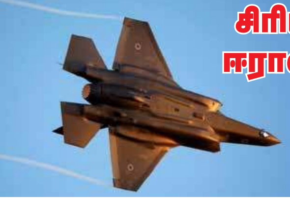
உள்நாட்டு போரால் பேரழிவை சந்தித்துள்ள சிரியாவுக்கும், இஸ்ரேலுக்கும் இடையே பல ஆண்டுகளாக மோதல் நிலவி வருகிறது.

இந்த நிலையில் இரு நாட்டு எல்லைப்பகுதியில் ஈரான் நாட்டின் ஆதரவு பெற்ற ஈரான் புரட்சிப்படை பிரிவினரும், வெளிநாட்டு போராளிகளும் இருந்தவாறு இஸ்ரேல் மீது ஏவுகணைகளை வீசி தாக்குதல் நடத்தி வருகின்றனர். இவர்களை அழிக்க இஸ்ரேல் ராணுவம் சிரியாவில் அவ்வப்போது விமானப்படையினர் தாக்குதல் நடத்துவதுண்டு. நேற்றைய தாக்குதலானது கடந்த இரு வாரங்களில் சிரியா மீது நடாத்தப்படும் நான்காவது தாக்குதல் ஆகும்.