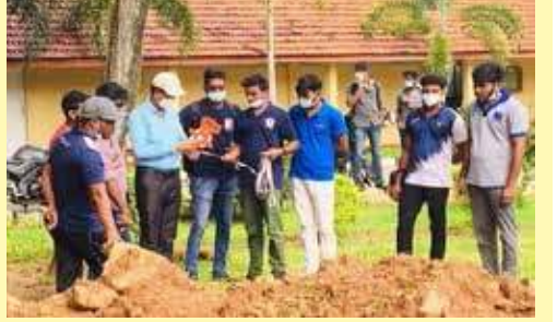
போன்றன கணிக்கப்பட்டன. இடித்து அழிக்கப்பட்ட அதே இடத்தில் மீண்டும் தூபியை அமைப்பதற்கான ஆரம்பக் கட்ட பணிகள் மேற்கொள்ளப்பட்டன.

யாழ்ப்பாணம், ஜன.14 யாழ்ப்பாணம் பல்கலைக்கழக வளாகத்தில் முள்ளிவாய்க்கால் நினைவுத்தூபியீண்டும் அமைப்பதற்கான வேலைத் திட்டங்கள் ஆரம்பிக்கப்பட்டுள்ளன. யாழ்ப்பாணம் பல்கலைக்கழக துணை வேந்தரின் பணிப்புக்கு அமைய பொறியியல் வேலை பகுதியினரால் அளவீடுகள் மற்றும் கட்டிட வரைபடம் வரையும் பணி நேற்று (புதன்கிழமை) இடம்பெற்றது. மாணவர்களின் மேற்பார்வையோடு பொறியியலாளர், பல்கலைக்கழக கட்டிடப் பணியாளர்கள் மற்றும் மேற்பார்வை பிரிவினரால் நில அளவுத்திட்ட பிரமாணங்கள்