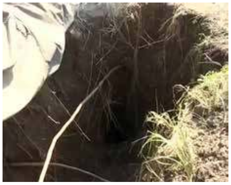
பாகிஸ்தானின் ஷாகோகர் பகுதி உள்ளது. அப்பகுதி, பயங்கரவாதிகள் பயிற்சி முகாம் களுக்கும், தளங்களுக்கும் பெயர் பெற்றது ஆகும். இந்த பாதை, புதிதாக கட்டப்பட்டதா அல்லது பழையதா என்பது விசாரணைக்கு பிறகு தெரிய வரும். ஆனால், மணல் மூட்டைகளில் தயாரிப்பு ஆண்டு 2016

பாகிஸ்தான் பகுதியில் உள்ளது. இந்த தகவல் அறிந்தவுடன், எல்லை பாதுகாப்பு படை ஐ.ஜி. ஜம்வால் உள்ளிட்ட அதிகாரிகள் அங்கு நேரில் சென்று பார்வையிட்டனர். பின்னர், ஐ.ஜி. ஜம்வால் நிருபர்களுக்கு அளித்த பேட்டியில் கூறியதாவது:- இந்த சுரங்கப்பாதை, சம்பா, கதுவா மாவட்டங்களில் கடந்த 6 மாதங்களில் கண்டுபிடிக்கப்பட்ட 3 ஆவது சுரங்கப் பாதை ஆகும். அந்த சுரங்கப்பாதைகள் போலவே இதுவும் உள்ளது. பாகிஸ்தானில் இருந்து காஷ்மீருக்குள் பயங்கரவாதிகள் ஊடுருவ வசதியாக இது கட்டப்பட்டுள்ளது. பயன்படுத்தப்பட்ட மணல் மூட்டைகளில் பாகிஸ்தான் குறியீடு காணப்படுகிறது. எனவே, பாகிஸ்தான் அரசு அமைப்பு களின் தொடர்பு இருப்பது தெளிவாகிறது. சுரங்கப்பாதையின் மறுமுனையில்,