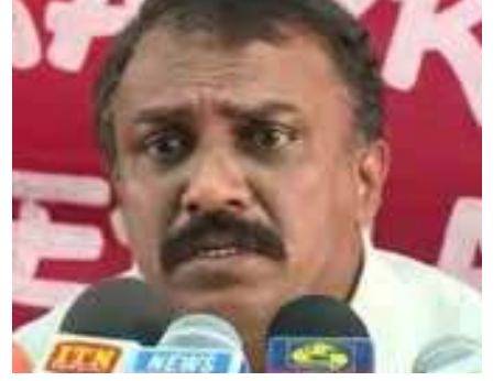
வழங்கல் ஆகியவை சங்கத்தின் பிரதான கோரிக்கைகளாகக் காணப்படுகின்றன.

பணிப்புறக்கணிப்பு போராட்ட தீர்மானத்தின் பின்னர் இராஜாங்க அமைச்சர் பேச்சுக்கு அழைப்புவிடுத்தார். இந்தச் சந்திப்பின் போது தனியார் பஸ் உரிமையாளர் சங்கத்தால் 6 கோரிக்கைகள் முன்வைக்கப்பட்டன. தனியார் மற்றும் அரசு பஸ் சேவையை ஒரு நிர்வாகக் கட்டமைப்பின் கீழ் கொண்டு வரல், லொக்சீட் சேவைக்கான நவம்பர், டிசெம்பர் மாதத்துக்கான கட்டணம் அறவிடல் இரத்து செய்தல், லீசிங் வசதிகளை வழங்கல், நிவாரண கூடல் வழங்கல், போக்குவரத்து சேவையில் ஈடுபடும் பேருந்துகளுக்கு சுகாதார பாதுகாப்பு உபகரணங்களை