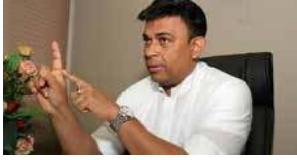
அடிப்படையில், சபாநாயகரை ஐக்கிய மக்கள் சக்தியான எதிர்ணி அதிகாரபூர்வமாகக் கோரும்' என பதிவேற்றி யுள்ளார்.

'ரஞ்சன் ராமநாயக்கவை நாடாளுமன்ற கூட்டங்களில் சமூகமளிக்க அனுமதிக்குமாறும், இது நீதிமன்ற வரம்புக்கு வெளியே நாடாளுமன்றத்தின் உரிமை என்ற