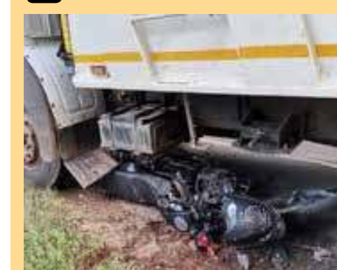
வவுனியா -செட்டிக்குளம் நகர்பகுதியில் நேற்று (திங்கட்கிழமை) காலை இடம்பெற்ற

விபத்தில், ஒருவர் படுகாயமடைந்து வைத்தியசாலையில் சேர்க்கப்பட்டுள்ளார்.