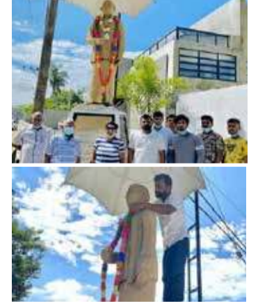
மைப்பின் மாவட்ட நாடாளுமன்ற உறுப்பினர் இராசமாணிக்கம் இரா. சாணக்கியனின் பாட்டனார் என்பது குறிப்பிடத்தக்கது.

இலங்கைத் தமிழரசுக்கட்சியின் முன்னாள் தலைவர் சி.மு. இராசமாணிக்கத்தின் 108 ஆவது ஜனநினைவாக கடந்த புதன்கிழமை நினைவு கூரப்பட்டுள்ளது. கடந்த 1952 ஆண்டு தமிழ் மக்களின் பிரதிநிதியாக பட்டிசெருப்பு தொகுதியை பிரதிநிதித்துவப்படுத்தி நாடாளுமன்றத்துக்குத் தெரிவாகியிருந்தமையுடன், இலங்கைத் தமிழ் அரசுக்கட்சியின் தலைவராகவும் 1970 ஆண்டு வரை செயற்பட்டிருந்தார். இந்த நிலையிலேயே களுவாஞ்சிக் குடியிலுள்ள சி.மு. இராசமாணிக்கத்தின் சிலைக்கு மலர் மாலை அணிவித்து நினைவுகூரல் நிகழ்வு இடம்பெற்றுள்ளது. இவர் தமிழ்த்தேசியக் கூட்ட