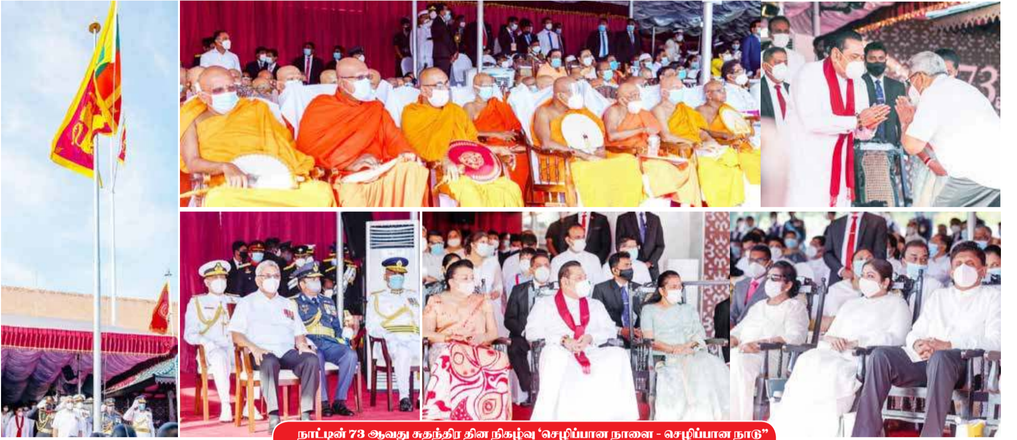
நாட்டின் 73 ஆவது சுதந்திர தின நிகழ்வு 'செழிப்பான நாளை - செழிப்பான நாடு' எனும் தொனிப் பொருளில் சுதந்திரச் சதுக்கத்தில் இடம்பெற்றது. ஜனாதிபதி கோட்டாபய ராஜபக்ஷ, பிரதமர் மஹிந்த ராஜபக்ஷ, எதிர்க்கட்சித் தலைவர் சஜித் பிரேமதாஸ ஆகியோர், சுதந்திர நிகழ்வில் பாரியார்கள் சகிதம் கலந்துகொண்டனர். ஜனாதிபதி கோட்டாபய ராஜபக்ஷ, தேசியக் கொடியை ஏற்றி நிகழ்வை ஆரம்பித்து வைத்தார்.