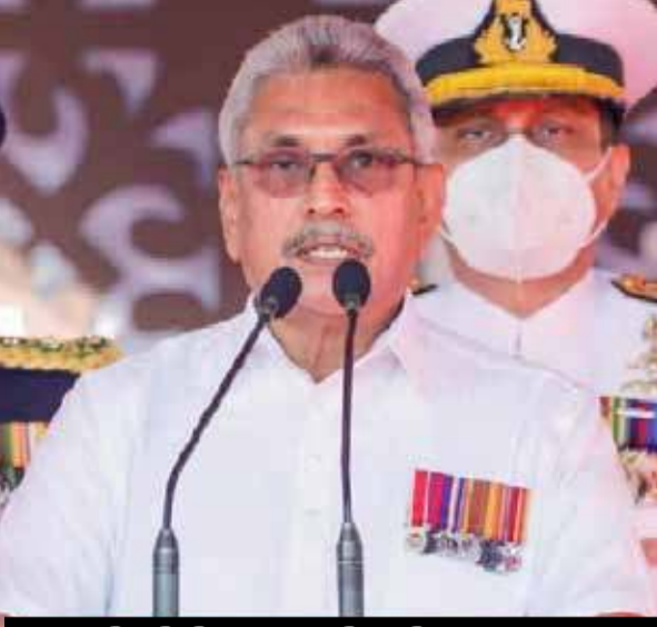
ஊனாதிபதியின் சுதந்திர தின உரை - 2021

“நாட்டில் வாழும் சகல இனங்களைச் சேர்ந்த மக்களும் சம உரிமையுடன் வாழவேண்டும். இன மத அடிப்படையில் உரிமைகள் பிரிக்கப்படுவது தவறானதாகும்.