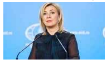
களை மிக உயர்ந்த மற்றும் உயர் மட்டங்களில் பராமரிக்கிறோம்.

இலங்கையின் 73 ஆவது சுதந்திர தினத்தை முன்னிட்டு ரஷ்ய வெளியுறவு அமைச்சக செய்தித் தொடர்பாளர் மரியா ஜாகரோவா ரஷ்யா சார்பில் தனது வாழ்த்துக்களைத் தெரிவித்துள்ளார். இலங்கை மக்கள் காலனித்துவவாதிகளுக்கு எதிரான போராட்டத்தில் நீண்ட தூரம் பயணித்து வந்துள்ளனர். பிரிட்டிஷ் காலனித்துவ ஆட்சியின் ஒரு நூற்றாண்டுக்கு மேலாக 1948 இல் நாடு சுதந்திரம் பெற்றது. நவீன இலங்கை இறை யாண்மை, ஜனநாயக மற்றும் சமூக நோக்குடைய அரசாக உலகில் தகுதியான மரியாதை பெறுகிறது. அதன் குடிமக்கள் தங்கள் பண்டைய வரலாற்றை மட்டுமல்லாமல், பொருளாதார வளர்ச்சித் துறையில் அவர்கள் செய்த பெரிய சாதனைகளையும் பெருமையாகக் கருதுகின்றோம்.