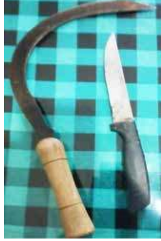
சம்பவம் தொடர்பான விசாரணைகள் தொடர்ந்தும் இடம் பெற்று வருகின்றது.