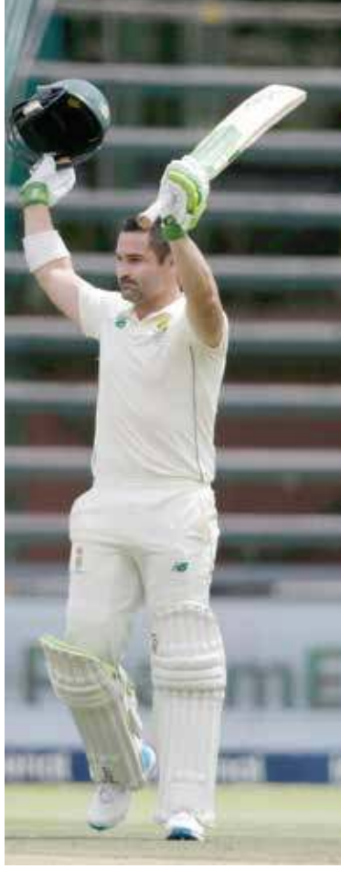
எல்கர் அபாரமாக அரைச்சதம் கடந்து 92 ஓட்டங்களையும், டுசென் 40 ஓட்டங்களையும் எடுத்து - தென்னாபிரிக்கா ஒரு விக்கெட் இழப்புக்கு 148 ஓட்டங்களை பெற்ற வேளை

எய்டன் மார்க்ரம் 5 ஓட்டங்களுடன் ஆட்டமிழந்தார். ஆனால், அடுத்து வந்த வான் டெர் டுசென் எல்கருடன் இணைந்து சிறப்பான ஆட்டத்தை வெளிப்படுத்தினார்.