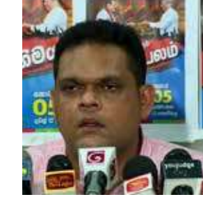
இந்த நுண்நிதிக்கடனினால் பாதிக்கப்பட்டவர்களில் 93 சதவீதமானோர் பெண்களாவர்