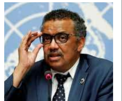
மீதான விமர்சனங்கள் அதிகரிக்க ஏதுவான மற்றொரு காரணியாக மாறியுள்ளது.

இந்நிலையில் கொரோனா வைரஸின் தோற்றம் குறித்து ஆராய நியமிக்கப்பட்டுள்ள உலக சுகாதார அமைப்பின் சர்வதேச வல்லுநர் குழுக்களுக்கும் அனுமதி வழங்காமல் சீனா தொடர்ந்து இழுத்தடித்து வருவது அந்நாட்டின்