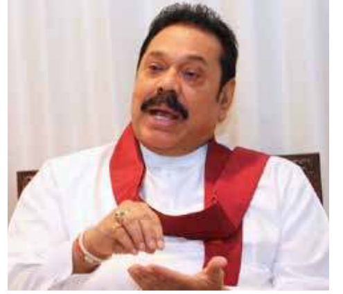
அபிவிருத்தியையும், கொழும்பு தெற்கு முனைய அபிவிருத்தியையும் தற்போது எமது ஆட்சியில் முன்னெடுத்து வருகின்றோம்-என்றார்.

நிறுவனங்களுக்கு வழங்க எமது அரசு எந்தத் தீர்மானமும் எடுக்கவில்லை. கடந்த 2005 - 2015 வரையான ஆட்சிக்காலத்தில் கொழும்பு தெற்கு முனையத்தின் அபிவிருத்தியை முன்னெடுத்தோம். அரசு - தனியார் முறைமையின் கீழ் 35 ஆண்டு கால ஒப்பந்தம் செய்யப்பட்டு நடவடிக்கை முன்னெடுக்கப்பட்டது. அதேபோல் கொழும்பு கிழக்கு முனைய