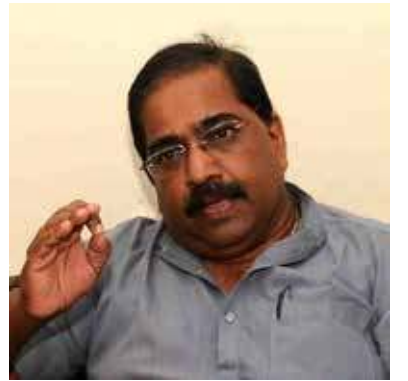
பட்டுள்ளன. அந்தத் தரப்பினர் இக்கோரிக்கைகளை ஏற்றுக்கொண்டு கையொப்பமிடும் இடத்து விரைவில் ஐ.நா.செயலாளர் நாயகம் அன்ரோனியோ குட்டரெஸ், ஐ.நா.மனித உரிமைகள் ஆணையாளர் மிச்செல் பச்செலட் மற்றும் உறுப்பு நாடுகளுக்கு அனுப்பி வைப்பதற்கு நடவடிக்கைகள் எடுக்கப்படவுள்ளது-என்றார்.