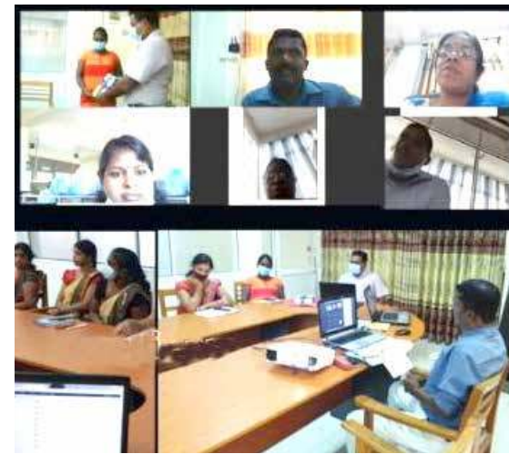
கிளிநொச்சி, ஜன. 07

பூநகரி பிரதே செயலகமும் கலாசார பேரவையும் இணைந்து வடக்கு மாகாண பண்பாட்டலுவலர்கள் திணைக்களத்தின் அலுவலர்களின் ஆண்டு தோறும் வெளியிடப்படும் "பூந்துணர்" இதழின் 2020 ஆம் ஆண்டுக்கான நவம்பர் 10 இலத்திரனியல் மலர் நேற்று நடைபெற்றது.