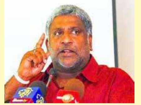
இலவசமாக கொரோனா தடுப்பூசி கிடைக்கின்றது. அதனால் ஏனையவர்களுக்கான தடுப்பூசியை அரசாங்கம் பணம் செலுத்திப் பெற்றுக்கொள்ள நடவடிக்கை எடுத்திருக்கின்றது. - என்றார்.

அத்துடன் எமது நாட்டு சனத்தொகையில் 56 தொடக்கம் 60 வீதமானவர்களுக்கே கொரோனா தடுப்பூசி வழங்க முடியும் என சுகாதாரப் பிரிவினர் தெரிவித்திருக்கின்றனர். 18 வயதுக்கு கீழ்ப்பட்டவர்களுக்கு தடுப்பூசி செலுத்துவது நல்லதல்ல எனத் தெரிவிக்கப்பட்டிருக்கின்றது. அதேபோன்று 20 வீதமானவர்களுக்கு