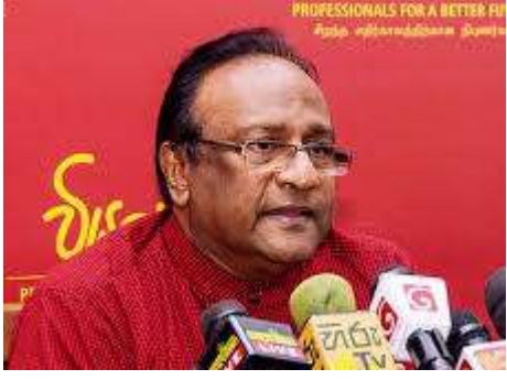
18 வயதிற்கு மேற்பட்ட இளைஞர் யுவதிகளுக்கு இராணுவப் பயிற்சி வழங்க

வது தொடர்பான தனது கருத்தை நாடாளுமன்ற உறுப்பினர் சி.வீ. விக்னேஸ்வரன் வரவேற்றிருப்பது தனக்கு மகிழ்ச்சி அளிப்பதாக பொதுமக்கள் பாதுகாப்பு அமைச்சர் சரத் வீரசேகர தெரிவித்தார்.