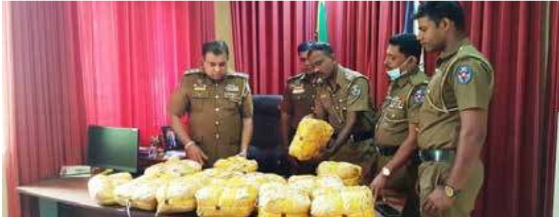
கைது செய்யப்பட்டுள்ளார். இணைகளை பொலிஸார் மேற்கொண்டு இது தொடர்பான மேலதிக விசாரணைகளை வரகின்றனர்.

கிளிநொச்சி விவேகானந்தா நகர் பகுதியில் வீட்டுக் கூரைக்குள் மறைத்து வைக்கப்பட்டிருந்த 25 கிலோ 456 கிராம் கஞ்சாவினை கிளிநொச்சி பொலிஸ் பிரிவின் மது ஒழிப்பு பிரிவினாரால் மீட்கப்பட்டுள்ளது. கிளிநொச்சி பொலிஸ் பிரிவின் மது ஒழிப்பு பிரிவினாருக்கு கிடைத்த இரகசியத் தகவலையடுத்து கஞ்சா மறைத்து வைக்கப்பட்டிருந்த வீடு சுற்றி வளைக்கப்பட்டு கஞ்சா மீட்கப்பட்டதோடு. வீட்டு உரிமையாளரும்