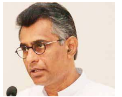
மத்திய வங்கியால் 100 மில்லியன் அமெரிக்க டொலர்களைச் சந்தைக்குக் கொடுத்ததன் மூலமாகவே இப்போது ரூபாவின் விலை கட்டுப்படுத்தப்பட்டுள்ளது. இந்தப் பணமெல்லாம் நல்லாட்சி அரசாங்கத்தில் சேமிக்கப்பட்ட பணம் என்பதையும் மறந்துவிடக்கூடாது. இவ்வாறான பயணத்தை முன்னெடுத்து நாட்டை முன்னோக்கி கொண்டு செல்ல முடியாது. அரசாங்கத்துக்கு மிக நெருக்கடியான நிலைமையே இன்று காணப்படுகின்றது. ஆனால் அரசாங்கத்தில் உள்ள எவருக்கும் இந்தப் பிரச்சனைகள் விளங்கவில்லை- என்றார். (எ)

அதேபோன்று ரூபாவின் விலை வீழ்ச்சி கண்டதால் 100 மில்லியன் அமெரிக்க டொலர்களை செலுத்தி ரூபாவின் வீழ்ச்சியைக் கட்டுப்படுத்த வேண்டியதாகிவிட்டது.