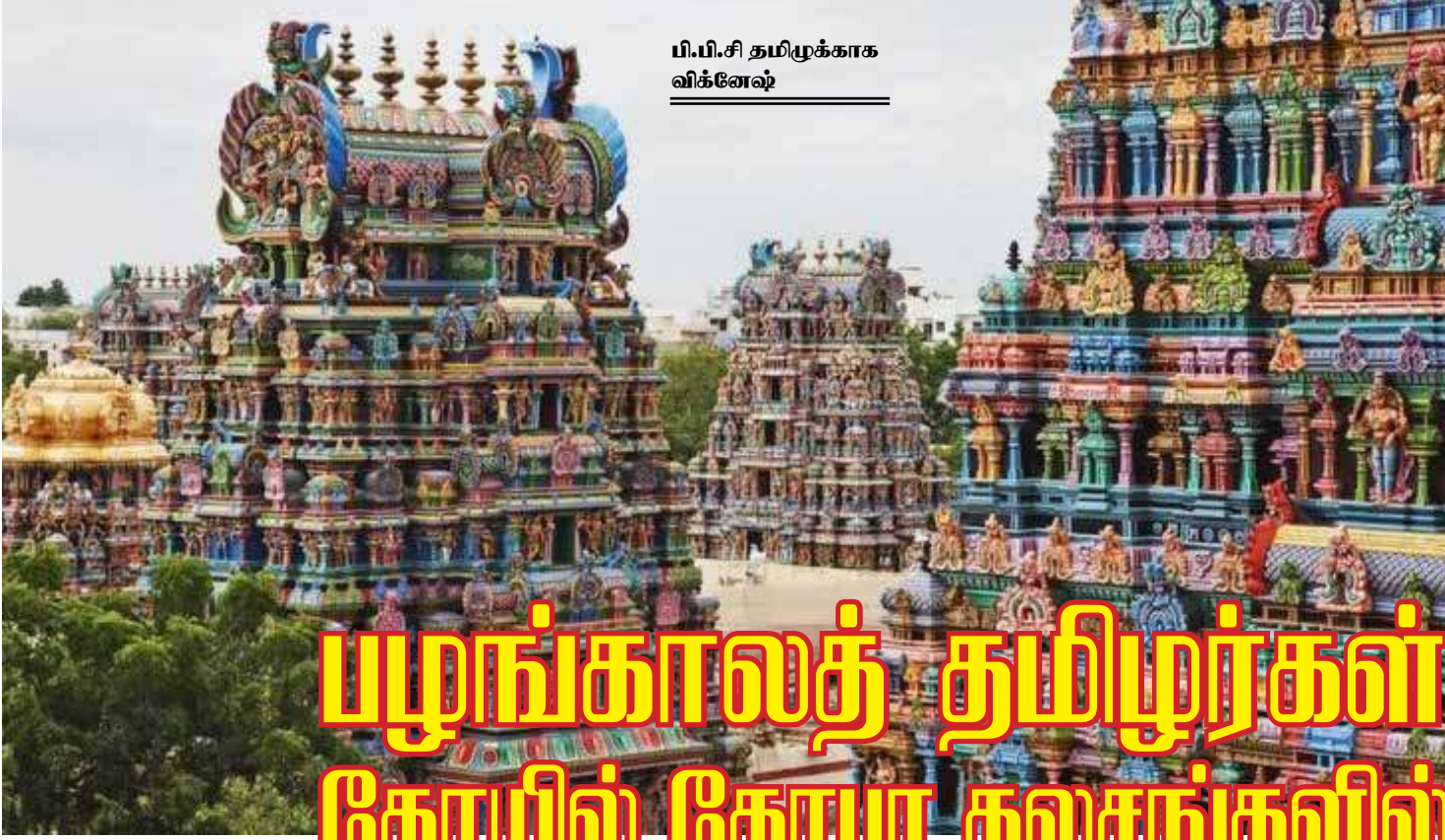
பி.பி.சி தமிழர்க்காக விக்னேஷ்