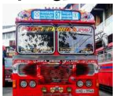
முதல் மீண்டும் ஆரம்பிக்கப்பட்டுள்ளது.

எனினும், முன்னர் பகல், இரவு சேவையாக இது இடம் பெற்றது. இந்நிலையில், தற்போது பகல் சேவை மட்டுமே ஆரம்பிக்கப்பட்டுள்ளது. இரவு சேவையும் விரைவில் ஆரம்பிக்கப்படும் என்றும் தெரிவிக்கப்பட்டது. (ஐ-2)