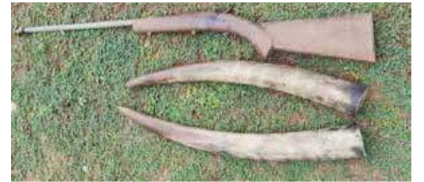
ராசிகள் திணைக்களத்தினரும் தீவிர விசாரணைகளை மேற்கொண்டனர்.

அத்துடன், அதன் தந்தத்திற்காக அது கொல்லப்பட்டிருக்கலாம் என்று சந்தேகிக்கப்பட்டது. ஏனெனில், தந்தம் இருந்த இடங்களில் அது அறுக்கப்பட்டமைக்கான அடையாளங்களும் தலையில் துப்பாக்கி சூட்டால் ஏற்படுத்தப்பட்ட காயங்களும் காணப்பட்டன. இது தொடர்பில் பொலிஸாரும், வன ஜீவ