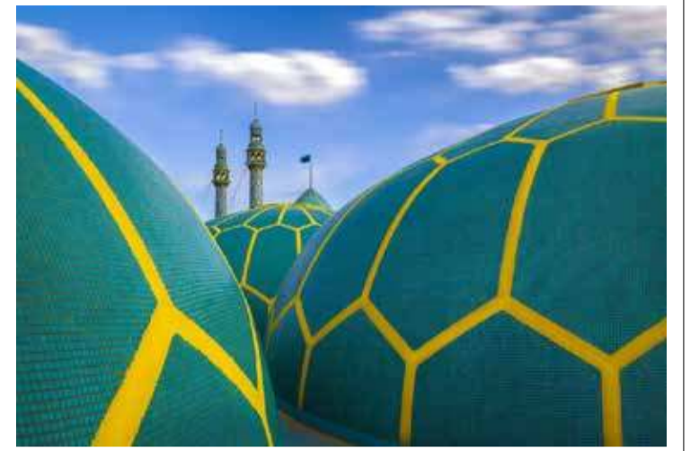
2020 ஆம் ஆண்டின் சிறந்த கட்டடக்கலையின் ஒளிப்படப் போட்டியை 'சார்ட்டர்ட் இன்ரிரியூட் ஒவ் பில்டிங்' நிறுவனம் நடத்தியது. இதில் தெரிவான ஈரானின் ஜம்கரன் பள்ளிவாசலின் தோற்றமே இது...

இந்தத் தீர்மானம் நகரசபையில் ஏகமனதாக ஏற்றுக்கொள்ளப்பட்டது. இந்நிலையிலேயே அமையவுள்ள தூபிக்கு முள்ளி வாய்க்கால் நினைவுத் தூபி என்பதற்கு பதிலான 'தமிழ் இனவழிப்பு நினைவுத் தூபி' எனப் பெயர் மாற்றப்பட்டு தீர்மானம் இயற்றப்பட்டுள்ளது. (ஐ)