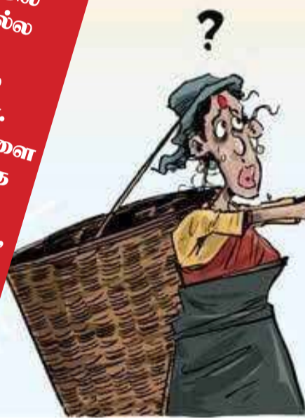
படை நாட் சம்பளமாக ஆயிரம் ரூபா கிடைக்காது என்பதனை அரசு உறுதிப்படுத்தி விட்டது.

ஆரம்ப மாகியிருந்தாலும், பொதுத்தேர்தல் நெருங்கியதால், இலங்கைத் தொழிலாளர் காங்கிரஸால் ஆயிரம் ரூபா சம்பளம் அவசியமென்ற கோரிக்கை தேர்தல் குண்டாக வீசப்பட்டது.