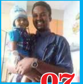
07 கொரோனாவால் முதல் மருத்துவரை இழந்தது இலங்கை