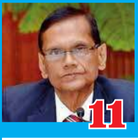
11 கல்வித்துறைக்கு கொரோனா தடையாகாது