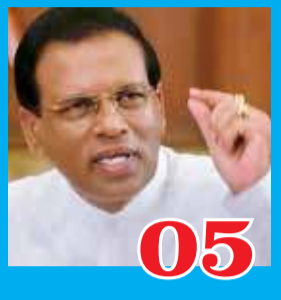
05 தமிழரின் போராட்டத்தை கொச்சைப்படுத்தாதீர்