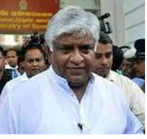
கொழும்பு, பெப். 03

ஐனாதிபதி கோட்டாபய ராஜபக்ஷவின் கொள்கைகள் சிறப்பானதாக அமையும் பட்சத்தில் அவருக்கு ஒத்துழைப்பு வழங்குவேன் என்று இலங்கை கிரிக்கெட் அணியின் முன்னாள் தலைவரும், ஐக்கிய தேசியக் கட்சி உறுப்பினருமான அர்ஜுன ரணதுங்க தெரிவித்தார். எதிர்கால அரசியல் நகர்வுகள் தொடர்பில் விவரிக்கையிலேயே அவர் இவ்வாறு கூறினார். இது தொடர்பில் அவர் மேலும் கூறியவை வருமாறு: - நான் தற்போது ஐக்கிய தேசியக்கட்சியிலேயே அங்கம் வகிக்கின்றேன். அக்கட்சி எடுக்கும் முடிவுகளின் அடிப்படையிலேயே தொடர்ந்தும் அங்கம் வகிப்பதா, வெளியேறுவதா என்பது குறித்து தீர்மானம் எடுக்கப்படும். நான் மக்களுடன், மக்களுக்காகவே அரசியல் நடத்துகின்றேன். நாட்டை நேசிக்கும் அரசியல்வாதிகளே எமக்கு தேவைப்படுகின்றனர். இதன்காரணமாகவே எப்போதும் நல்ல அரசியல்வாதிகளுடன் பய