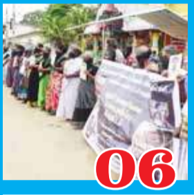
06 காணாமல் ஆக்கப்பட்டோர் போராட்டம்