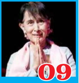
மியன்மாரில் இராணுவ ஆட்சி