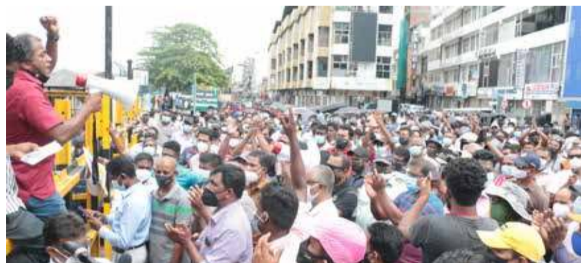
கொழும்புத்துறைமுகத்தின் கிழக்கு முனையத்தை இந்திய நிறுவனத்துக்கு வழங்குவதற்கு எதிர்ப்புத் தெரிவித்து கொழும்பில் நேற்று பல்வேறு பகுதிகளில் எதிர்ப்புப் போராட்டங்கள் முன்னெடுக்கப்பட்டன.