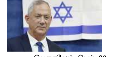
ஜெருசலேம், பெப். 02 பலஸ்தீனத்திற்கு 5 ஆயிரம் கொரோனா தடுப்பூசிகளை இஸ்ரேல் வழங்கும் என்று தெரிவிக்கப்பட்டுள்ளது. கொரோனா தடுப்பூசியை மக்களுக்கு செலுத்தும் பணியை இஸ்ரேல் ஆரம்பித்துள்ளது. இதனிடையே, இஸ்ரேல் தனது அயல் நாடான பலஸ்தீனத்திற்கு தடுப்பூசிகளை வழங்க மறுத்து வருகின்றது என்று ஐ.நாவும் சர்வதேச மனித உரிமைகள் அமைப்புகளும் குற்றம் சாட்டின. இந்த விடயத்தில் நீண்ட இழுபறிக்குப் பின்னர் பலஸ்தீனத்துக்கு கொரோனா தடுப்பூசிகளை வழங்க இஸ்ரேல் சம்மதம் தெரிவித்துள்ளது. இதன் அடிப்படையில், பலஸ்தீனத்தில் முன்கள பணியாளர்களுக்கு முன்னுரிமை அளிக்கும் வகையில் 5 ஆயிரம் தடுப்பூசிகளை இஸ்ரேல் வழங்கவுள்ளது என்று அந்நாட்டின் இராணுவ அமைச்சர் பென்னி காண்ட்ஸ் தெரிவித்தார். (ஐ)