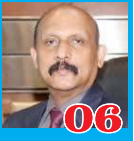
சிங்களத்தில் மட்டுமே தேசிய கீதம்