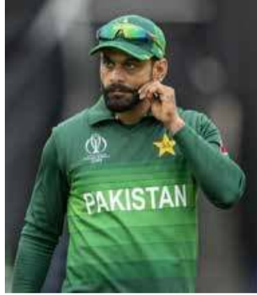
தார். இதற்கு பாகிஸ்தான் கிரிக்கெட் சபை மறுத்துவிட்டது. கடந்த ஆண்டு இருபது - 20 போட்டிகளில் சிறப்பான ஆட்டத்தை ஹபீஸ் வெளிப்படுத்தியிருந்

இஸ்லாமாபாத், பெப். 02 தென்னாபிரிக்காவுக்கு எதிரான இருபது - 20 தொடரில் பாகிஸ்தான் அணியில் மூத்த வீரர் முஹமது ஹபீஸ் நீக்கப்பட்டுள்ளார். பாகிஸ்தான் கிரிக்கெட் சபையில் ஒப்பந்தத்தில் இல்லாத முகமது ஹபீஸ், தற்போது ஐக்கிய அரபு எமிரேட்ஸில் 10 ஓவர் கிரிக்கெட் போட்டியில் விளையாடி வருகிறார். இந்நிலையில், தென்னாபிரிக்காவுக்கு எதிரான இருபது - 20 தொடரில் விளையாட இருக்கும் வீரர்கள் தனிமைப்படுத்தல் வலயத்தில் இருக்கும் அவர் நாளை அணியுடன் இணைய வேண்டும் என்று அறிவுறுத்தியுள்ளது. பத்து - 10 போட்டியில் இருப்பதால் நாளை தினத்தின் பின்னர் அணியுடன் இணைவதற்கு முஹமது ஹபீஸ் அனுமதி கேட்டிருந்