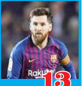
மெஸ்ஸியின் மதிப்பு ரூ. 11.775 கோடி