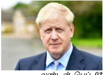
லண்டன், பெப். 02 ஆசியா - பசுபிக் பிராந்தியத்தை சேர்ந்த 11 வளர்ச்சி அடைந்த மற்றும் வளர்ந்து வரும் நாடுகள் அடங்கிய, கூட்டமைப்பில் இணையப் போவதாக, ஐரோப்பிய நாடான, பிரிட்டன் தெரிவித்துள்ளது. ஐரோப்பிய ஒன்றியத்தில் இருந்து, பிரிட்டன், கடந்த ஆண்டு, ஜனவரியில் முறைப்

படி வெளியேறியது. அதைத் தொடர்ந்து, மற்ற நாடுகளுடன், தொழில் மற்றும் வர்த்தக உறவுக்கான முயற்சி களில் பிரிட்டன் ஈடுபட்டு வருகிறது. இந்நிலையில், 11 நாடுகள் அடங்கிய, டிரான்ஸ் பசுபிக் ஒத்துழைப்புக்கான கூட்டமைப்பில் இணைவதற்கு, பிரிட்டன் விண்ணப்பித்துள்ளது. இதை பிரிட்டன் பிரதமர் பொரிஸ் ஜோன்சன் தெரிவித்துள்ளார். அவுஸ்திரேலியா, புருவே, சனடா, சிலி, ஐப்பான், மலேசியா, மெக்சிகோ, நியூசிலாந்து, பெரு, சிங்கப்பூர் மற்றும் வியட்நாம் ஆகியவை இந்த கூட்டமைப்பில் உள்ளன.