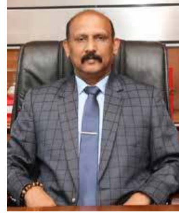
உள்நாட்டு அலுவல்கள் அமைச்சுடன் இணைந்து நடவடிக்கை மேற்கொண்டுள்ளோம். இதுதொடர்பில், பெரும் வேலைத்திட்டம் மேற்கொள்ளப்பட்டுள்ளது. இதில் இறுதி நடவடிக்கையாக இந்த விடயத்தை பாராளுமன்றத்தில் சமர்ப்பித்து அதை நிறைவேற்றிக் கொள்ளவேண்டும். இதனால் இம்முறை தேசிய சுதந்திர தின வைபவத்தை நடத்தும் பொழுது இதிலும் பார்க்க மேலதிகமாக ஏதும் செய்வதற்கு இல்லை. இதனால் நாம் முன்னர் பயன்படுத்திய தேசிய கொடியை நாம் பயன்படுத்துவோம். தேசிய கொடியில் எந்த மாற்றமும் இல்லை. சிங்கத்தின் உருவத்தில் உள்ள குறைபாடுகள் குறிப்பிடப்பட்டுள்ளன. இவற்றை நிவர்த்தி செய்துகொள்ள வேண்டும். இதனை வடிவமைப்பாளர்களுடனும், அரசாங்க அதிகாரிகளுடனும் இணைந்து பேச்சுவார்த்தை நடத்தி இதற்கு தேவையான நடவடிக்கைகள் மேற்கொள்ளப்பட்டு வருகின்றது-என்றார்.

கடந்த காலம் முதல் தேசிய கொடி தொடர்பில் உள்ள குறைபாடுகள் குறித்து பேசப்பட்டு வந்தது. இந்நிலையில், அந்த குறைபாடுகள் இம்முறை நீக்கப்பட்டுள்ளதா? என்று ஊடகவியலாளர் ஒருவர் நேற்று நடைபெற்ற செய்தியாளர் மாநாட்டில் எழுப்பிய கேள்விக்கு செயலாளர் பதிலளிக்கையில், தற்பொழுது நாம் தேசிய கொடி ஒன்றைப் பயன்படுத்துகின்றோம். சமூகத்தில் பல்வேறு தரப்பினர் இதில் உள்ள குறைபாடுகள் குறித்து சுட்டிக்காட்டினர். தேசிய கொடியில் சிங்கத்தின் உருவத்தில் உள்ள குறைபாடுகள் திருத்தி வடிவமைக்க வேண்டும் எனச் சுட்டிக்காட்டியுள்ளனர். இவர்கள் அனைவரினதும் ஆலோசனைகளை நாம் பெற்றுக்கொண்டுள்ளோம். இதுதொடர்பில் உள்நாட்டு அலுவல்கள் அமைச்சுடன் இணைந்து நடவடிக்கை மேற்கொண்டுள்ளோம். இதுதொடர்பில், பெரும் வேலைத்திட்டம் மேற்கொள்ளப்பட்டுள்ளது. இதில் இறுதி நடவடிக்கையாக இந்த விடயத்தை பாராளுமன்றத்தில் சமர்ப்பித்து அதை நிறைவேற்றிக் கொள்ளவேண்டும். இதனால் இம்முறை தேசிய சுதந்திர தின வைபவத்தை நடத்தும் பொழுது இதிலும் பார்க்க மேலதிகமாக ஏதும் செய்வதற்கு இல்லை. இதனால் நாம் முன்னர் பயன்படுத்திய தேசிய கொடியை நாம் பயன்படுத்துவோம். தேசிய கொடியில் எந்த மாற்றமும் இல்லை. சிங்கத்தின் உருவத்தில் உள்ள குறைபாடுகள் குறிப்பிடப்பட்டுள்ளன. இவற்றை நிவர்த்தி செய்துகொள்ள வேண்டும். இதனை வடிவமைப்பாளர்களுடனும், அரசாங்க அதிகாரிகளுடனும் இணைந்து பேச்சுவார்த்தை நடத்தி இதற்கு தேவையான நடவடிக்கைகள் மேற்கொள்ளப்பட்டு வருகின்றது-என்றார்.