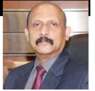
தெரிவித்தார். பரிசோதனை அறிக்கைகள் ஒழுங்காக இருந்தால் மாத்திரமே படையினர் அணிவகுப்பில் ஈடுபடுத்தப்படுவார்கள் என்றும் அவர் குறிப்பிட்டார்.

கொழும்பு, பெப்.02 இலங்கையின் 73ஆவது சுதந்திர தின நிகழ்வில் சிங்கள மொழியில் மாத்திரமே தேசிய கீதம் இசைக்கப்படும் என பாதுகாப்புச் செயலர் கமல் குணரத்ன தெரிவித்தார்.