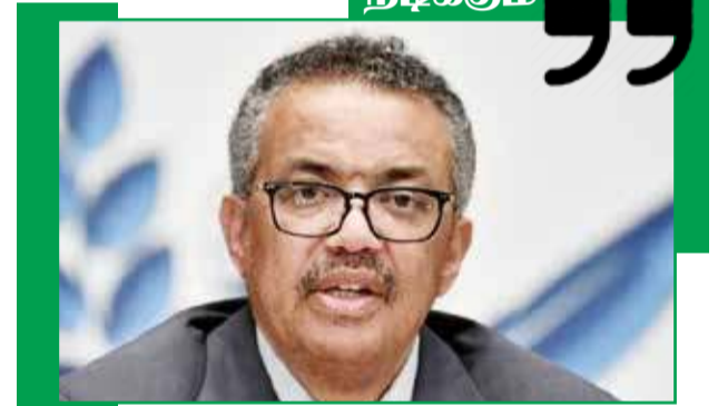
70 ஏழை நாடுகள் தங்கள் மக்களில் 10இல் ஒருவருக்கு மட்டுமே கொரோனா தடுப்பூசியை வழங்க முடியும் என்று அந்த அமைப்பு எச்சரித்திருந்தது.

“முதலில் எனக்கு தான் தடுப்பூசி என்கிற அணுகுமுறை, நம்மை நாடே தோற்கடித்துக் கொள்ளும் விதத்தில் அமையும். இது தடுப்பூசியின் விலையை அதிகரிக்கும், பதுக்கலை ஊக்குவிக்கும். இது போன்ற செயல்களால் கொரோனா நீண்ட நாட்களுக்கு நம்மிடையே நீடிக்கும்”