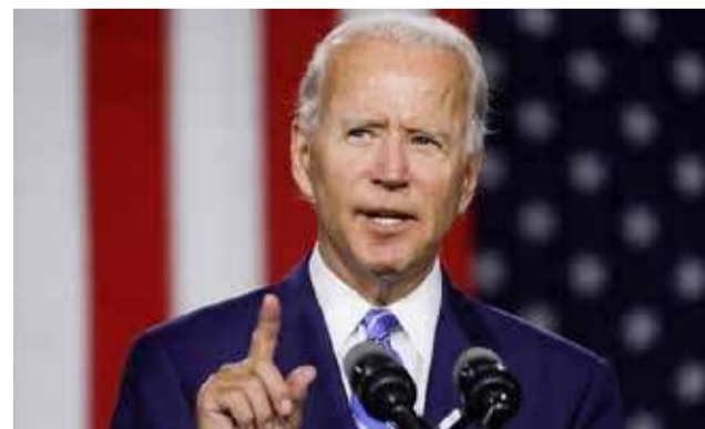
எதிர்பார்த்தைவிட வேலை இழப்புகள் அதிகரித்து வருவதுடன், நுகர்வோர் பொருட்களின் விற்பனையும் சரிவை

எனினும், பொருளாதாரத்தின் மற்ற கூறுகள் இன்னமும் பல்வேறுபட்ட பிரச்சனைகளை சந்தித்து வருகின்றன. அண்மைய மாதங்களில் அமெரிக்காவில்