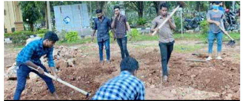
யாழ். பல்கலையில் முள்ளிவாய்க்கால்