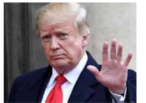
பங்கேற்பதற்காக உள்ளூர் நேரப்படி நண்பகல் 12 மணியளவில் (இலங்கை நேரப்படி இரவு 10.30) பாராளுமன்றக் கட்டட வளாகத்துக்கு சென்றார்.

உள்ளூர் நேரப்படி, நேற்று புதன்கிழமை காலை வெள்ளைமாளிகைக்கு சென்ற பைடன், பின்னர் பதவியேற்பு நிகழ்வில்