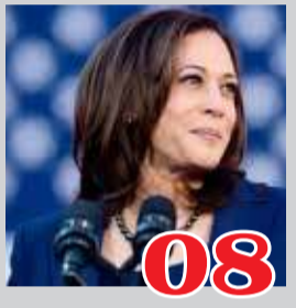
08 அமெரிக்க வாழ் இந்தியர்கள் மீது குவியும் கவனம்!