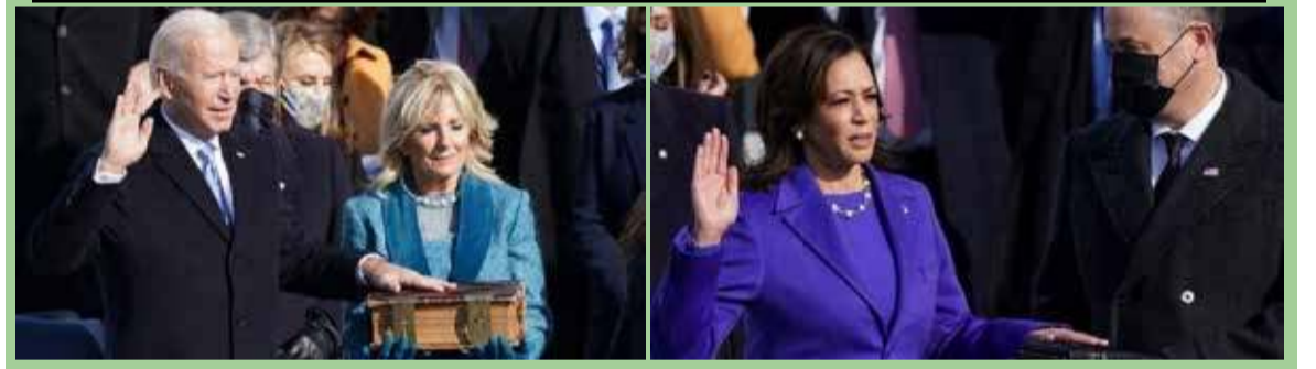
வொஷிங்டன், ஜன. 21 அமெரிக்காவின் முதல் பெண், ஆசிய வம்சாவளி, ஆபி