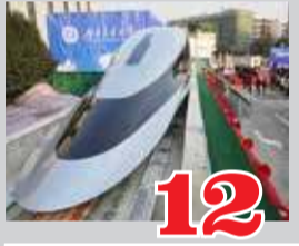
12 சீனாவில் மிதக்கும் ரயில் அறிமுகம்