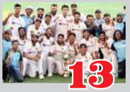
13 முதலிடத்தில் இந்திய அணி!