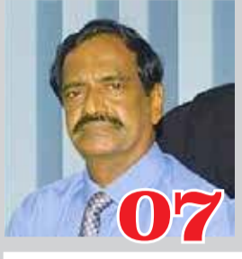
07 மாகாண தேர்தலை நடத்த தயார்