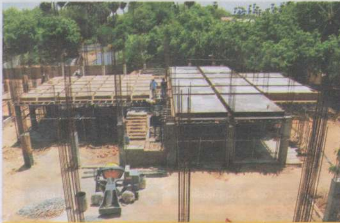
நடைபெற்றுக் கொண்டிருக்கிற மருத்துவமனைக் கட்டுமானப் பணிகள்

வெகு சீக்கிரத்தில் இந்த மருத்துவமனை கட்டி முடிக்கப்பட வேண்டும். இதற்காக ஜெபியுங்கள். கர்த்தருடைய இந்த உன்னதமான பணிக்காக, ஏவப்படுகிறபடி கொடுத்துத் தாங்க உங்களை அன்போடு அழைக்கிறேன்.