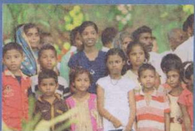
நாம் தாங்கும் ஆதிவாசிக் குழந்தைகள்