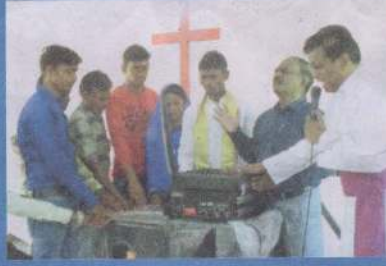
ஒலி பெருக்கிக் கருவிகள்