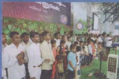
மிஷனரிப் பிரதிஷ்டையும், ஜெபமும்