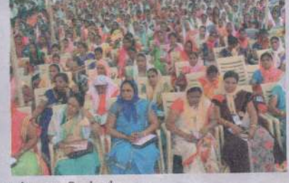
முகாமில் கலந்து கொண்ட ஊழியர்கள்