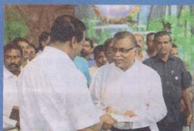
ஆலயம் கட்ட நிதி உதவி வழங்கல்