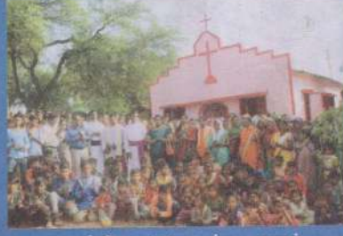
'நண்டேலா' ஆலயம் - குஜராத்