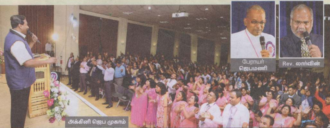
அக்கினி ஜெப முகாம்

Faith Church ஊழியங்களின் 25வது வருடாந்திர நிறைவைக் கொண்டாடும் விதமாக, அக். 25, 26, 28 தேதிகளில், அங்குள்ள South Borough High Schoolல் வைத்து, 'அக்கினி ஜெப முகாம்!' நடத்தப்பட்டது. இம்முகாமில் சுமார் 1,500க்கும் அதிகமான தேவ பிள்ளைகள் கலந்து கொண்டு, கண்ணீரோடும், மிகுந்த பாரத்தோடும் ஜெபித்தார்கள்.