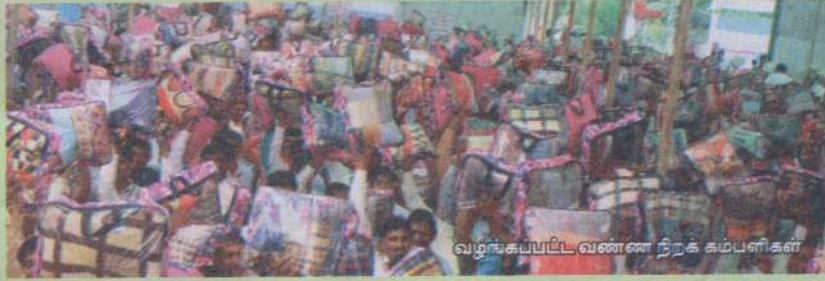
வழங்கப்பட்ட வண்ண நிறக் கம்பளிகள்

கலந்து கொண்ட அனைவருக்கும் சிறப்புப் பரிசாக வண்ண நிறக் கம்பளி ஒன்று வழங்கப்பட்டது. நமது ஊழியத்தின் செலவில் நடத்தப்பட்ட இந்த