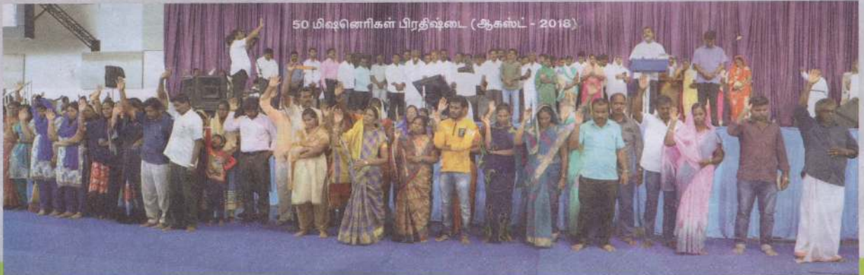
50 மிஷனரிகள் பிரதிஷ்டை (ஆகஸ்ட் - 2018)