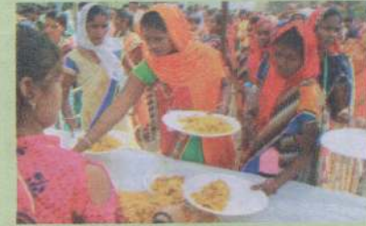
சுவையான உணவு வழங்கல்

ஒவ்வொரு ஊழியர்களும் தங்கள் 'பீல்' இன மக்கள் இரட்சிக்கப்பட வேண்டும் என்ற பாரத்தோடும், தரிசனத்தோடும் புறப்பட்டுச் சென்றனர்.