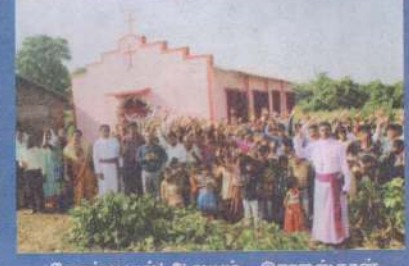
'ஜோக்டிமால்' ஆலயம் - இராஜஸ்தான்