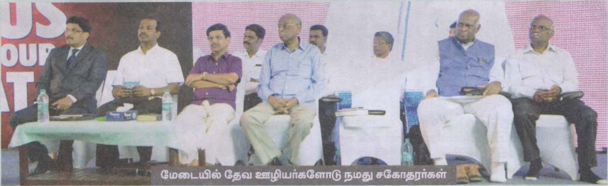
மேடையில் தேவ ஊழியர்களோடு நமது சகோதரர்கள்