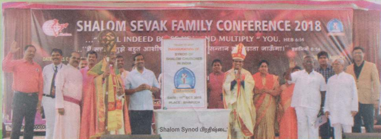
'Shalom Synod பிரதிஷ்டை'