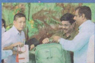
மிஷனரிகளுக்கு சிறப்புப் பரிசு