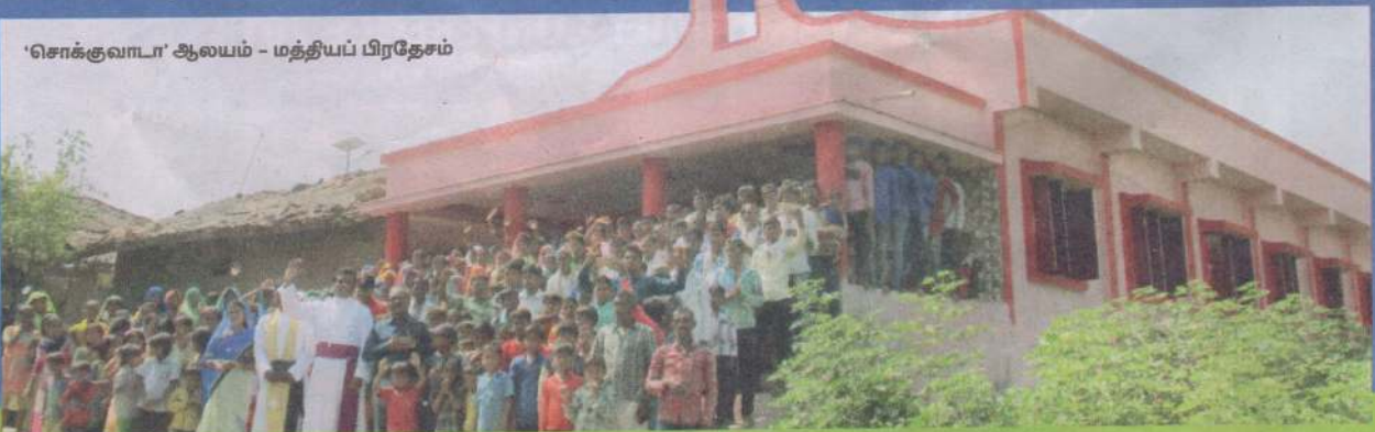
'சொக்குவாடா' ஆலயம் - மத்தியப் பிரதேசம்