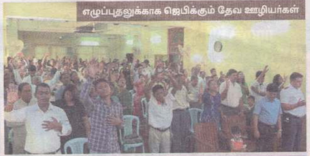
எழுப்புதலுக்காக ஜெபிக்கும் தேவ ஊழியர்கள்