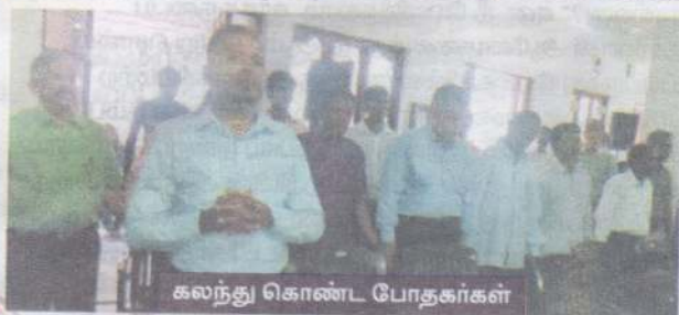
கலந்து கொண்ட போதகர்கள்