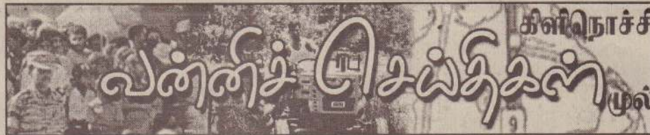
கிளிநொச்சி மாவட்ட அண்மையர் முன்னணி உறுப்பினர்கள் கைவேலி 100 வீட்டுத்திட்டத்தில் நடைபெற்ற கருத்தரங்கில் கலந்துகொண்டனர்.

பொறுப்பாளர் வேண்டி ஆகியோர் கருத்துரைகளை வழங்கினர். இந்த நிகழ்வில் பொதுமக்கள் அதிகளவில் பங்கேற்று தமது கருத்துக்களைத் தெரிவித்தனர். (ஏ-204)