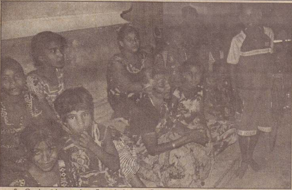
சில இடங்களில் 'சுனாமி' ஒலி எழுப்பப்பட்டது. இன்னும் சில இடங்களில் கோயில்கள், தேவாலயங்களின் மணிகள் ஒலிக்கப்பட்டன. உறக்கத்தில் இருந்த மக்கள் பதறி அடித்துக்கொண்டு பாதுகாப்பான இடங்களுக்கு ஓடினர். இன்று அதிகாலை யாழ்.நகரின் கரையோரப் பகுதியில் இருந்து வெளியேறி வந்து ஓ.எல்.ஆர். தேவாலயத்தில் தங்கியிருந்த மக்களைப் படத்தில் காணலாம்.