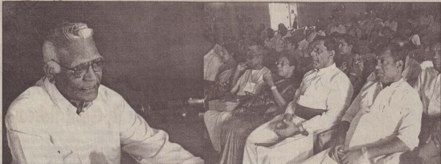
தந்தை செல்வாவின் 28ஆவது நினைவுதின நகழ்வீடு நிகழ்வில் கலந்துகொண்டவர்கள் ஒரு பகுதியினரையும் படங்களில் காணலாம்.

இதில் தமிழர் ஆசிரியர் சங்கத்தின் யாழ். மாவட்ட சகல கிளைகளினதும் தலைவர்கள், செயலாளர்கள், பொருளாளர் மற்றும் தாய்ச் சங்கங்களின் பிரதிநிதிகளையும் கலந்துகொள்ளுமாறு கேட்கப்பட்டுள்ளது. (எ-7)