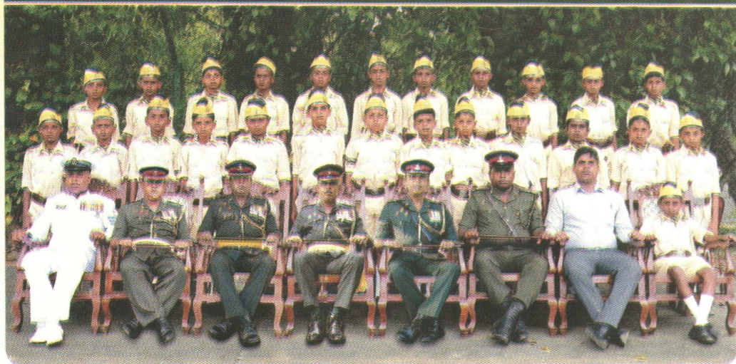
தேசிய கனிஷ்ட மாணவர் படையணி

JUNIOR CADET ASSESSMENT CAMP DETAIL III - 2018. KA/ KILINOCHCHI MATHTHIYA MAHA VITHTHIYALAYAM. 36 TH BATTALION