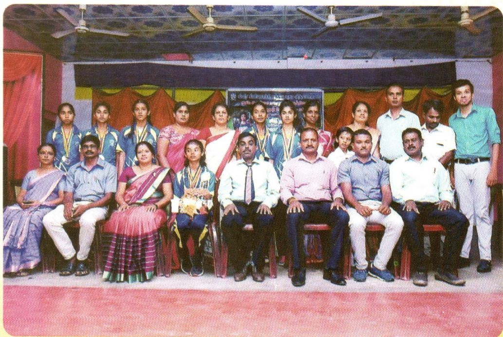
தேசிய மட்டப் போட்டிகளில் பங்கு பற்றிய மெய்வல்லுநர் அணி