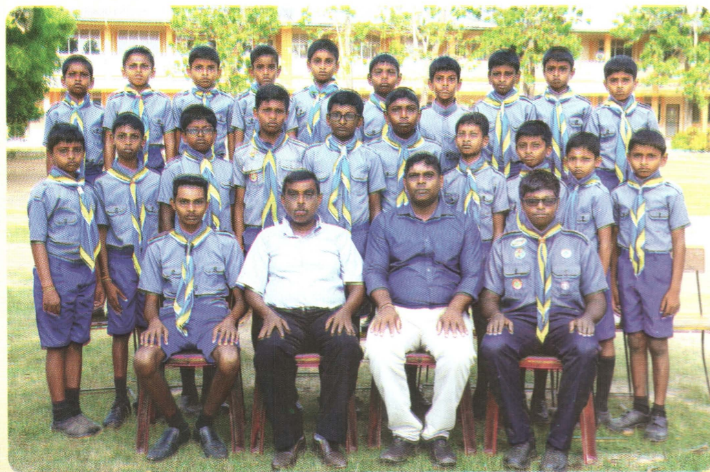
பாடசாலை சாரணிய அணி