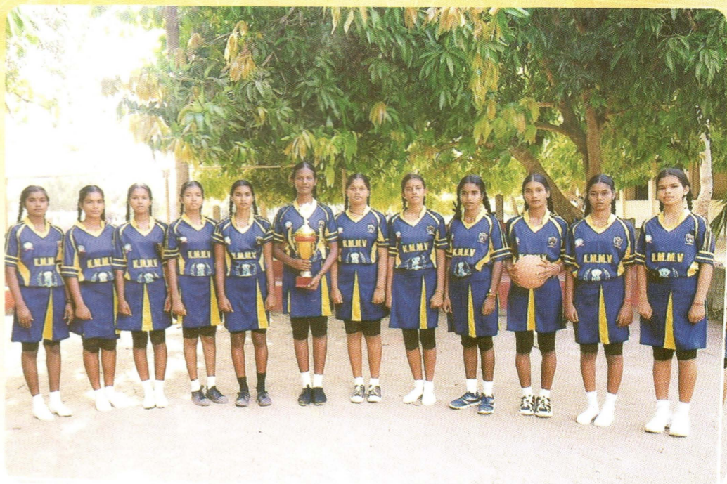
மாகாணமட்டப் போட்டியில் பங்குபற்றிய வலைப்பந்தாட்ட அணி