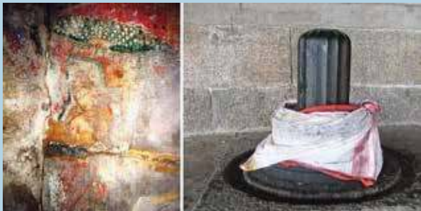
பணைமலை - தாளகிரீசுவரர் திருக்கோயில் பல்லவர்கால தாரா லிங்கம்

எண் பட்டைகளைக் கொண்ட அஷ்டதாரா லிங்கம் காஞ்சி கைலாசநாதர் கோவிலிலும், திருவதிகை கோவிலிலும் காணப்படுகிறது. இதன் எட்டுப்