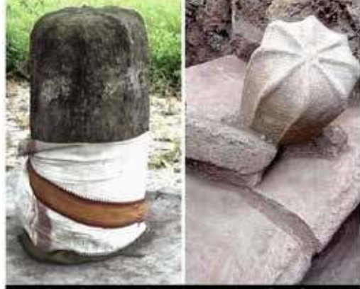
சுந்தூர் முருகன் கும்பகோணம்

அந்தவகையில் மிக அண்மையில் கையகப்படுத்தப்பட்ட இடமே குருந்தூர் மலைப்பகுதி.