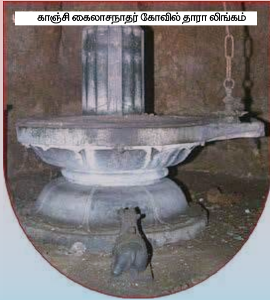
காஞ்சி கைலாசநாதர் கோவில் தாரா லிங்கம்

பட்டைகளும் நிலம், நீர், காற்று, நெருப்பு, ஆகாயம், சூரியன், சந்திரன், ஆன்மா ஆகியவற்றைக் குறிக்கும் என்பர். மேலும் எட்டு பைரவ சக்திகளையும், இறைவனின் அஷ்ட வீரச்செயல்களையும் குறிப்பன என்பர். சிதம்பரம் நவலிங்க சந்நிதியிலும் எட்டு திசை லிங்கங்கள் உள்ளன. இவை அஷ்டதாரா லிங்கங்களாகும்.