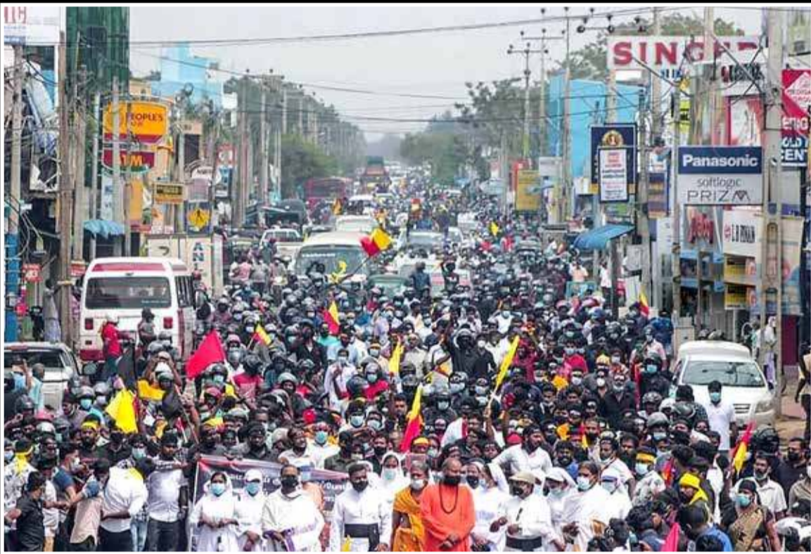
வடமராட்சி, பெப்ரவரி 08

தடைகள் தகர்த்து தமது அபிலாஷைகளை உலகுக்கு உரத்துச் சொன்னது தமிழினம்