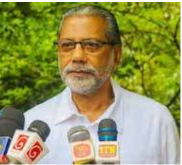
உலகத்துக்கு அடையாளப்படுத்துவோம். கடந்த அரசாங்கம் தேசிய மரபுரிமைகளைப் பாதுகாக்க உரிய நடவடிக்கைகளை முன்னெடுக்கவில்லை. வடக்கு மற்றும் கிழக்கு மாகாணங்களில் கடந்த மாதம் தொல்பொருள் ஆராய்ச்சி நடவடிக்கைகள் முன்னெடுக்கப்பட்டன. இதற்கு எதிராக தமிழ் அரசியல்வாதிகள் சட்டநடவடிக்கை முன்னெடுக்கவுள்ளதாகக் குறிப்பிடப்பட்டுள்ளது. அனைத்துச் சவால்களையும் வெற்றி கொள்ளத் தயாராகவுள்ளோம். தொல்பொருள் சின்னங்களைப் பாதுகாக்கும் விடயத்தில் எந்தவிதமான மக்களின் மத மற்றும் இன உரிமைகளும் பாதிக்கப்படவில்லை என்பதைத் தெளிவாகக் குறிப்பிட வேண்டும்- என்றார். (எ)

கொழும்பு, பெப். 06 தேசிய மரபுரிமைகளை அடையாளப்படுத்தும் சட்டம் பாராளுமன்றத்தில் சமர்ப்பிக்கப்படும். இலங்கையின் தேசிய மரபுரிமைகளைப் பாதுகாக்க அரசாங்கம் உரிய கவனம் செலுத்தியுள்ளது. தொல்பொருள் சின்னங்கள் திட்டமிட்ட வகையில் அழிக்கப்படுகின்றமை தொடர்பில் உரிய விசாரணை நடவடிக்கைகள் முன்னெடுக்கப்படுகின்றன என தேசிய மரபுரிமைகள், கலை கலாசார அலுவல்கள் இராஜாங்க அமைச்சர் விதூர விக்கிரமநாயக்க தெரிவித்தார். கல்முதுர பகுதியில் நேற்று முன்தினம் தொல்பொருள் சின்னங்களைப் பார்வையிட்டதன் பின்னர் ஊடகங்களுக்குக் கருத்துத் தெரிவிக்கையில் அவர் இவ்வாறு குறிப்பிட்டார். அவர் அங்கு மேலும் தெரிவிக்கையில்: நாட்டில் அனைத்துப் பகுதிகளிலும் தேசிய மரபுரிமைகள் காணப்படுகின்றன. மறைக்கப்பட்டுள்ள தேசிய மரபுரிமைகளை அடையாளப்படுத்தும் நடவடிக்கைகள் தற்போது வடக்கு மற்றும் கிழக்கு மாகாணத்தை முதன்மையாகக் கொண்டு முன்னெடுக்கப்படுகின்றன. நாடுதழுவிய ரீதியில் அகழ்வாராய்ச்சிப் பணிகளை முன்னெடுக்கத் தீர்மானிக்கப்பட்டுள்ளது. தொல்பொருள் பாதுகாப்புச் சட்டம் மாத்திரமே தற்போது நடைமுறையில் உள்ளது. இந்தச் சட்டத்தால் மாத்திரம் தேசிய மரபுரிமைகளைப் பாதுகாக்க முடியாது. ஆகவே தேசியமரபுரிமைச் சட்டத்தை பாராளுமன்றில் சமர்ப்பிக்கத் தீர்மானிக்கப்பட்டுள்ளது. சிகிரியா குன்று, தலதாமாளிகை ஆகியவை உலக மரபுரிமையாகக் காணப்படுகிறதே தவிர தேசிய மரபுரிமையாக அடையாளப்படுத்தப்பட வில்லை. இவற்றை தேசிய மரபுரிமையாக அடையாளப்படுத்துவதே அரசாங்கத்தின் பிரதான இலக்கு. தேசிய மரபுரிமைகளைப் பாதுகாக்க நாட்டு மக்கள் அனைவரும் பொறுப்புடன் செயல்பட வேண்டும். இவ்விடயத்தில் அரசியல் காரணிகளை முன்னிலைப்படுத்த முடியாது. தேசிய மரபுரிமைகளையும், நாட்டின் தனித்துவத்தையும்