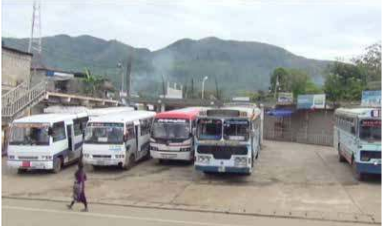
பாடாக நேற்று அமைதியான ஒரு நாள் பணிப்பகிஷ்கரிப்பை நடத்த அழைப்பு விடுத்திருந்தார். இந்நிலையில் மலையகத்தின் பெரும்பாலான பகுதிகளில் நாளாந்த வேதனத்தை ஆயிரம் ரூபாவாக அதிகரிக்குமாறு கோரி ஒருநாள் அடையாளப் பணிப்புறக்கணிப்புப் போராட்டம் முன்னெடுக்கப்பட்டது. (எ)