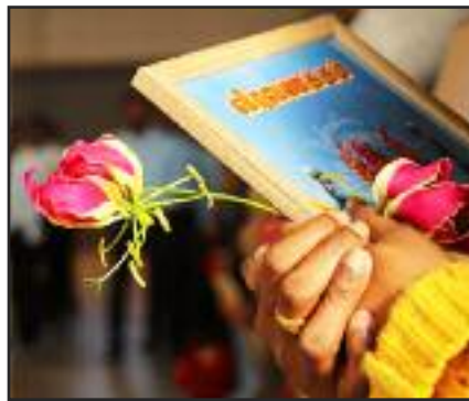
சலிப்பில்லாப் புலிப்படை சலிக்க வில்லை சாதனைகள் செய்தாரே சிறுதி வரையே.

செந்தமிழ் நாடகைச் சீரழித்த அந்தச் சிங்களப் பேய்களை ஒட்டித்தான் நந்தமிழ்ச் செல்வன் நற்றமிழ்ப் பிரபா நாடு மீட்க வந்திடவே வெந்த புழுக்களாய் வேதனைப் பட்டவர் வீழுகொண்டெழுந்தார் அவர்பின்னே நொந்து துடித்தே நோய்தந்த சிங்களம் நோய்தீர்க்க ஓடிய தயல்நாடே.