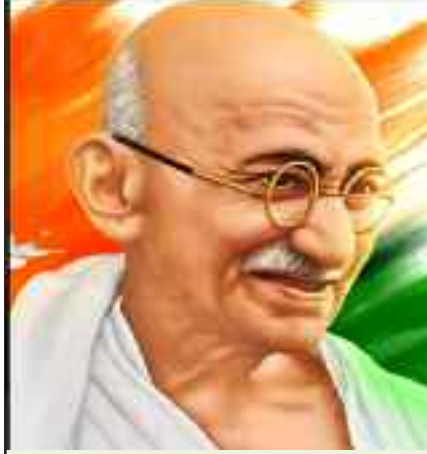
காந்தி ஜெயந்தி - 02.10.2020

பாரத தேசம் பசுமை இழந்து பசுமைவரின் ஆட்சியில் சிக்கலூட்டு சீரழிந்து சிதைந்திருந்த காலம் சிந்திய ரெத்தமும் கண்ணீருமாய் மக்கள் ஈரமிலாத ஆங்கிலேயனுக்கு அடிமைகளாய் இழிநிலையில் வாழ்ந்திருந்த நேரம் தீரமுடன் விடுதலைக்காய் போராடிய தியாகிகள் தீயோரின் வெஞ்சிறையில் வாடிய காலம்!