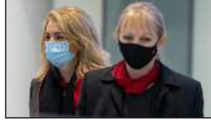
தடுப்பூசி போடப்படவில்லை” எனத் தெரிவித்திருக்கிறது.

அமர்த்த இயலாது என்றும் அவர்களுக்கும் விடுமுறை அவசியம் என்று கேட்டுக் கொண்ட தாலேயே விடுமுறை காலத்தில்