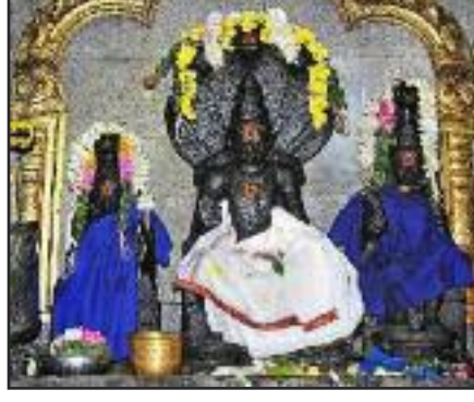
ஒரு நாளில் தரிசித்து வரலாம்.

நவகிரக ஆலயங்கள் அனைத்தும் தஞ்சையில் கும்பகோணத்தைச் சுற்றிலும் அமைந்துள்ளன. ஆகவே அனைத்து நவகிரகங்களையும் கும்பகோணத்தில் இருந்து சிறப்பு வாகனம் மூலம் சென்று