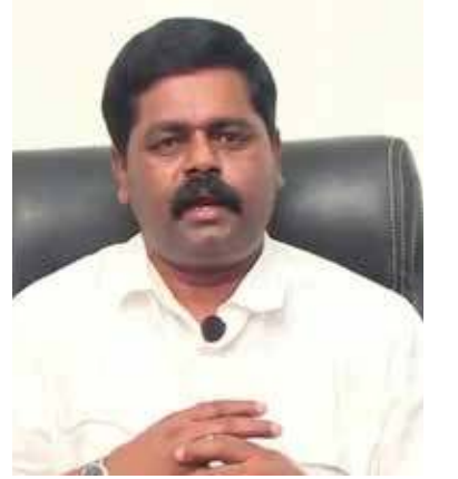
பனவை வழங்க முடியுமா? இந்தப் பிரச்சனைக்கு அரசாங்கம் தீர்வொன்றை முன்வைக்க வேண்டும்-என்றார்.