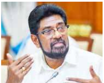
னங்களை அறிவிக்கும் ஊடக சந்திப்பில் அவர் இவ்வாறு

கொழும்பு, பெப்.10 2019 ஆம் ஆண்டு உயிர்த்த ஞாயிறு தினத்தன்று இடம்பெற்ற குண்டுத் தாக்குதல் தொடர்பில் விசாரணை செய்யும் ஜனாதிபதி ஆணைக்குழுவின் இறுதி அறிக்கையின் பரிந்துரைகள் தொடர்பில் அமைச்சரவையில் கலந்துரையாடப்படவில்லை என அமைச்சர் கெஹலிய ரம்புக்வேல தெரிவித்தார். கொழும்பில் நேற்று இடம்பெற்ற அமைச்சரவை தீர்மானங்களை அறிவிக்கும் ஊடக சந்திப்பில் அவர் இவ்வாறு