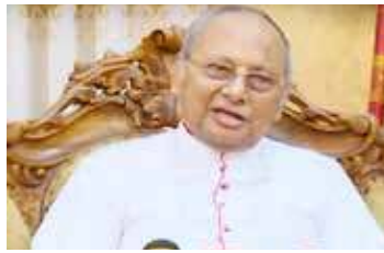
கொழும்பு, பெப்.10 ஜனாதிபதி கோட்டாபய ராஜபக்ஷவிடம் கையளிக்கப்பட்டுள்ள ஈஸ்டர் தாக்குதல் தொடர்பான அறிக்கையின் பரிந்துரைகளை தமக்கு வழங்குமாறு பேராயர்

தனது உயிருக்கு அச்சுறுத்தல் இருப்பதாகக் கூறி விசேட அதிரடிப் படை பாதுகாப்பை பெற்றுக் கொண்ட சுமந்திரன், ஆர்ப்பாட்டத்தில் கலந்து கொண்டிருந்த நிலையிலேயே அவருக்கான பாதுகாப்பு நீக்கப்பட்டது என்றும் அவர் குறிப்பிட்டார்.