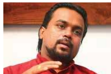
அமைச்சர் மங்கள சமரவீர இலங்கையைக் காட்டிக்கொடுத்து, அமெரிக்கா கொண்டு வந்த பிரேரணையை ஆதரித்ததன் விளைவாகவே எம்மால் எந்தவொரு சுயாதீன தீர்மானமும் எடுக்க முடியாது போனது. எனினும் நாம் இன்று அனைத்தையும் நிராகரிப்பதாக வெளிப்ப

கொழும்பு, பெப்.10 மஹிந்த ராஜபக்ஷ ஜனாதிபதியாக இருந்த காலத்தில் யுத்தத்தை முடிவுக்கு கொண்டுவந்து நாட்டில் சமாதானத்தை ஏற்படுத்திக்கொடுத்த பின்னர் தமிழீழ விடுதலைப்புலிகளை அழித்ததை விரும்பாதவர்களும், இந்நாட்டில் தமிழ், சிங்கள மக்கள் அமைதியாக வாழ்வதை விரும்பாதவர்களும் இன்று ஜெனிவாவில் கோஷம் எழுப்பி இலங்கையைத் தண்டிக்க முயற்சித்துக்கொண்டிருக்கின்றனர் என அமைச்சர் விமல் வீரவன்ச குற்றம்சாட்டியுள்ளார். முன்னைய ஆட்சியில் அப்போதைய வெளிவிவகாரத்துறை