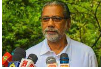
முடக்குவது தொல்பொருள் அகழ்வாராய்ச்சியின் நோக்கமல்ல.

நாட்டில் பல்லின மக்கள் வாழ்ந்து வருகிறார்கள். ஓர் இனத்தின் மதம் மற்றும் கலை, கலாசார மரபுரிமைகளை