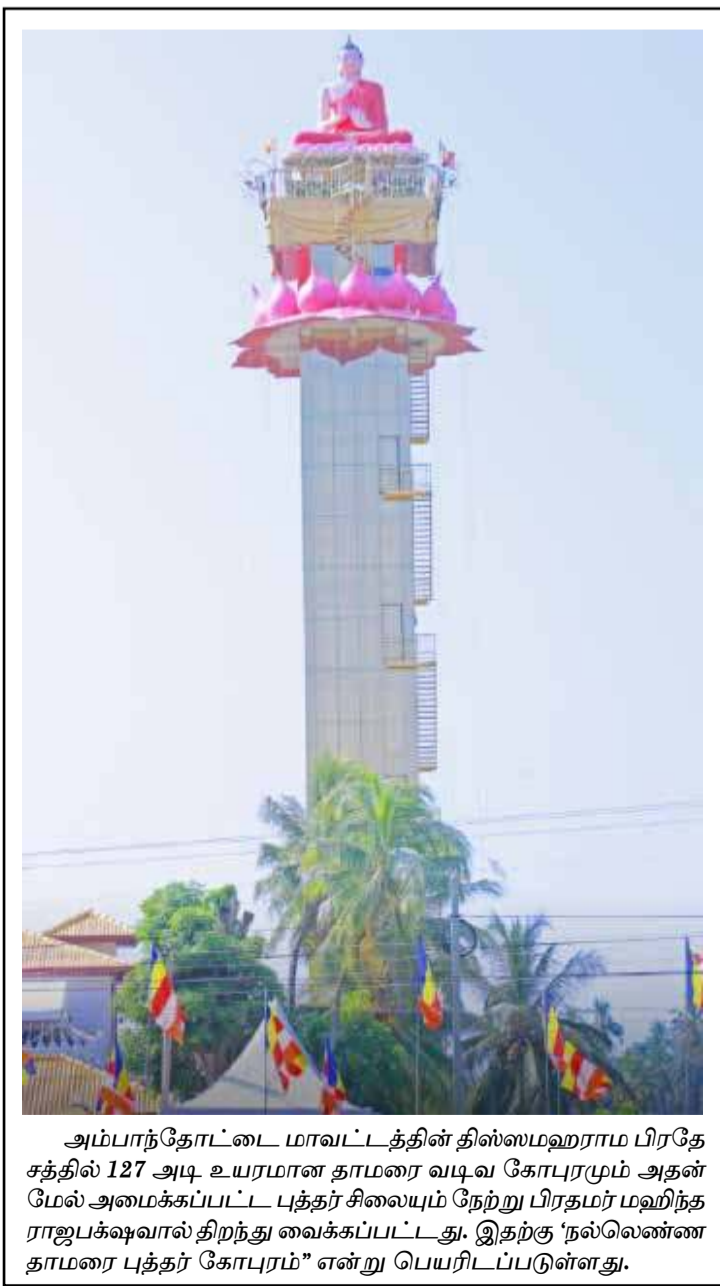
அம்பாந்தோட்டை மாவட்டத்தின் திஸ்ஸமஹராம பிரதே சத்தில் 127 அடி உயரமான தாமரை வடிவ கோபுரமும் அதன் மேல் அமைக்கப்பட்ட புத்தர் சிலையும் நேற்று பிரதமர் மஹிந்த ராஜபக்ஷவால் திறந்து வைக்கப்பட்டது. இதற்கு 'நல்லெண்ண தாமரை புத்தர் கோபுரம்' என்று பெயரிடப்பட்டுள்ளது.

எனவே, நோயாளர்கள், பார்வையாளர்களின் நலன் கருதி இந்த விடயத்தில் உடனடி நடவடிக்கையை வைத்தியசாலை நிர்வாகம் எடுக்க வேண்டும் என்றும் கேட்கப்பட்டுள்ளது. (ஐ-2)