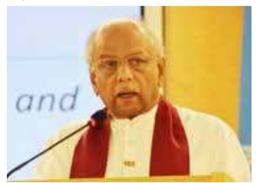
டும் என்றும் அவர் அழைப்பு விடுத்தார்.

கொழும்பு, பெப். 19 இலங்கையில் இடம்பெற்றதாகக் கூறப்படும் போர்க் குற்றச்சாட்டுக்கள் தொடர்பான விசாரணைகளை முன்னெடுப்பதற்கான சர்வதேச பொறிமுறைக்கு இலங்கை ஒரு போதும் அனுமதிக்காது என்று தெரிவிக்கப்பட்டுள்ளது.