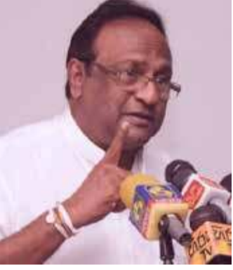
கொழும்பு ஊடகம் ஒன்றுக்கு அவர் இவ்வாறு குறிப்பிட்டார்.

தருஸ்மன் அறிக்கையை அடிப்படையாகக் கொண்டு இலங்கைக்கு எதிராக ஜெனிவாவில் குற்றச்சாட்டுக்கள் முன்வைக்கப்பட்டன. தருஸ்மன் அறிக்கை பொய்யான காரணிகளை உள்ளடக்கியுள்ளது என்பதை சர்வதேச யுத்த விஷேட நிபுணர்கள் ஆதார பூர்வமாக அறிக்கை சமர்ப்பித்துள்ளனர். இலங்கை தொடர்பில் ஐக்கிய நாடுகள் மனித உரிமைகள் பேரவையின் ஆணையாளர் அண்மையில் வெளியிட்ட அறிக்கையை