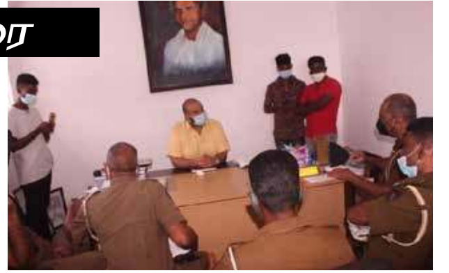
அது தொடர்பாக கவனம் செலுத்தப்பட்டதா போன்ற பல் வேறு கேள்விகள் கேட்கப்பட்டு வாக்குமூலங்கள் பதிவு செய்யப்பட்டன.

பொத்துவில் தொடக்கம் பொலிகண்டி வரையான போராட்டத்தின்போது நீதிமன்ற கட்டளை மீறப்பட்டதா, பொதுமக்களுக்கு போக்குவரத்துக்கு இடையூறு ஏற்படுத்தப்பட்டதா, கொரோனா அச்சுறுத்தல் உள்ள நிலையில்