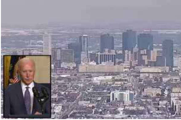
உள்ளாட்சி அமைப்புகள் உதவி செய்யவேண்டும் என்று தெரிவிக்கப்பட்டுள்ளது.

டெக்ஸாஸ் மாகாணத்தில் பெய்து வரும் பனிப்பொழிவை பெரும் பேரழிவு என அமெரிக்க அதிபர் ஜோ பைடன் அறிவித்துள்ளார். டெக்ஸாஸ் மாகாணத்தில் கடும் பனிப்பொழிவு காரணமாக மக்களின் இயல்பு வாழ்க்கை முற்றிலும் பாதிக்கப்பட்டுள்ளது. குடிதண்ணீர் அனைத்தும் உறைந்து விட்டதால் அப்பகுதியில் 13 மில்லியன் மக்கள் குடிதண்ணீருக்காக அவதிப்பட்டு வருவதாக தகவல்கள் வெளியாகி உள்ளன. தொடரும் பனிப்பொழிவால் இதுவரை 60க்கும் மேற்பட்டவர்கள் உயிரிழந்துள்ளனர். மாகாணத்தின் பெரும்பாலான பகுதிகளில் மின்சாரம் தடைபட்டுள்ளதால் மக்கள் பெரும் துயருக்கு ஆளாகி உள்ளனர். இதுகுறித்து வெள்ளை மாளிகை விடுத்துள்ள அறிக்கையில், கடும் குளிரால் பாதிக்கப்பட்ட மக்களுக்கு