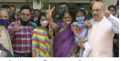
சேர்ந்தார். இன்றைய தினம் அகமதாபாத் மாநகராட்சியில் குடும்பத்தினருடன் வந்து வாக்களித்தார் அமித்ஷா.

சிகளை சேர்ந்த மொத்தம் 2276 வேட்பாளர்கள் களத்தில் உள்ளனர். தேர்தல் பாதுகாப்பு பணியில் சுமார் 43 ஆயிரம் பொலிஸார் ஈடுபடுத்தப்பட்டுள்ளனர். சுமார் ஒரு கோடியே 14 லட்சம் வாக்காளர்கள் இந்த தேர்தலில் வாக்களிக்கும் தகுதி பெற்றுள்ளனர். அகமதாபாத் மாநகராட்சி தேர்தலில் வாக்களிப்பதற்காக உள்துறை அமைச்சர் அமித்ஷா நேற்றிரவே குஜராத் வந்து