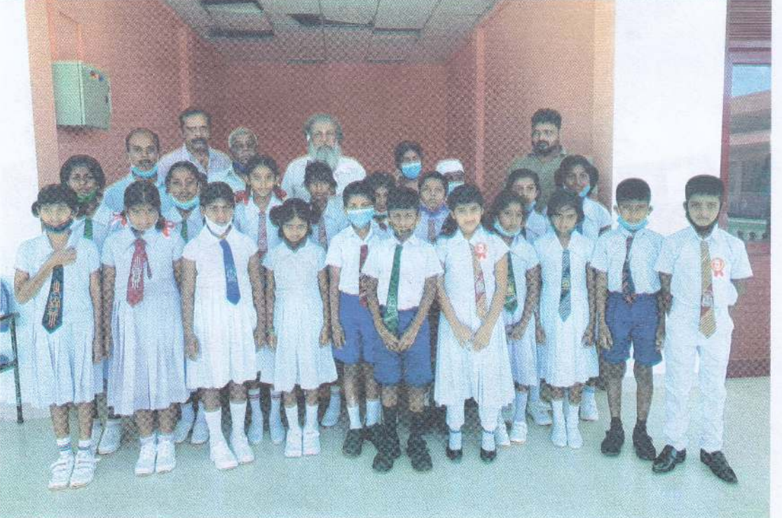
விழுதல் என்பது வேதனை. விழுந்த இடத்தில் மீண்டும் எழுதல் என்பது சாதனை.