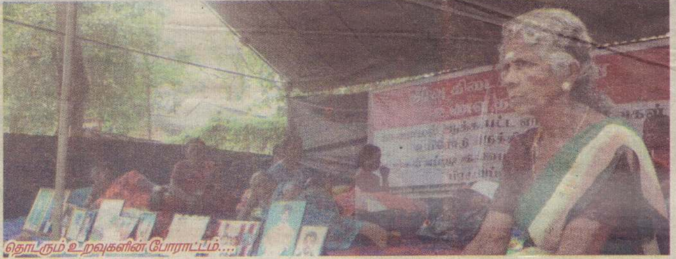
தொடரும் உறவுகளின் போராட்டம்....

இந்த விடயம் தொடர்பாக எதிர்க்கட்சித் தலைவரும் தமிழ்த் தேசிய கூட்டமைப்பின் நாடாளுமன்ற உறுப்பினருமான இரா.சம்பந்தன் நேற்று முன்தினம் அரச தலைவரோடு கலந்துரையாடியிருந்தார். இந்தப் பேச்சுக்களைத் தொடர்ந்து பிலக்குடியிருப்பு கிராமத்தில் பொது மக்களது 42 ஏக்கர் காணி நாளை விடுவிக்கப்படும் என்று அறிவிக்கப்பட்டது' என்று அமைச்சர் டி.எம்.சுவாமிநாதனின் செய்திக் குறிப்பில் தெரிவிக்கப்பட்டுள்ளது. (வ-5)