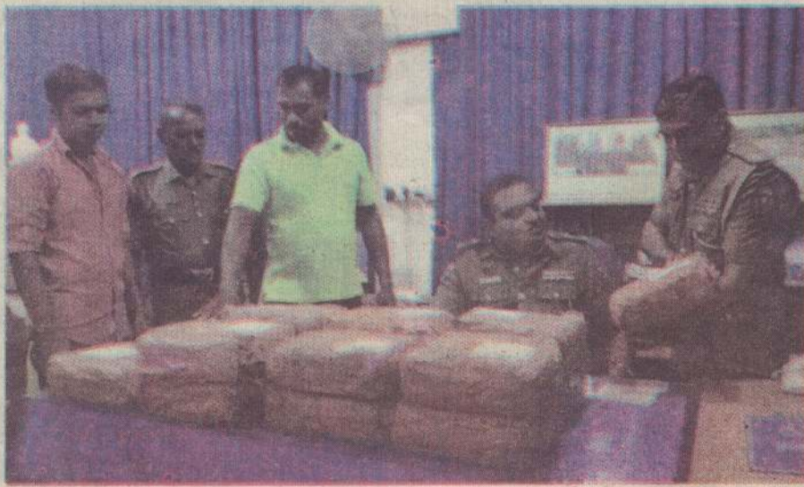
வவுனியா, புளியங்குளத்தில் கஞ்சா மீட்கப்பட்டுள்ளது என்று புளியங்குளம் பொலிஸார் தெரிவித்தனர். புவரசம் குளம் பகுதியில் வீடொன்றில் கஞ்சா பதுக்கப்பட்டுள்ளது என்று கிடைத்த தகவலையடுத்துப் பொலிஸார் மேற்கொண்ட தேடுதலில் 31 கிலோ 600 கிராம் கஞ்சா மீட்கப்பட்டது. சந்தேகத்தின் பேரில் இருவர் கைது செய்யப்பட்டனர். அவர்களை நீதிமன்றில் முற்படுத்த நடவடிக்கை எடுக்கப்பட்டுள்ளது என்று பொலிஸார் தெரிவித்தனர். (9-5)

யாழ்ப்பாணம், மார்ச் 1 நாகர்கோவில் பகுதியில் 225 கிராம் கஞ்சாவை வைத்திருந்த குற்றச்சாட்டில் நேற்று முன்தினம் இரவு 4 சந்தேகநபர்கள் கைது செய்யப்பட்டனர். நாகர்கோவில் பகுதியில் கஞ்சா கைமாற்றப்படவுள்ளது என்று பருத்தித்துறைப் பொலிஸாருக்குக் கிடைத்த இரகசியத் தகவலையடுத்து பொலிஸார் சோதனையில் ஈடுபட்டனர். கஞ்சா வழங்க வந்தவர் தப்பியோடிய நிலையில் நால்வர் கைது செய்யப்பட்டனர். இவர்கள் புத்தளம் பகுதியைச் சேர்ந்தவர்கள் என்று தெரிவிக்கப்பட்டது. (9-26)