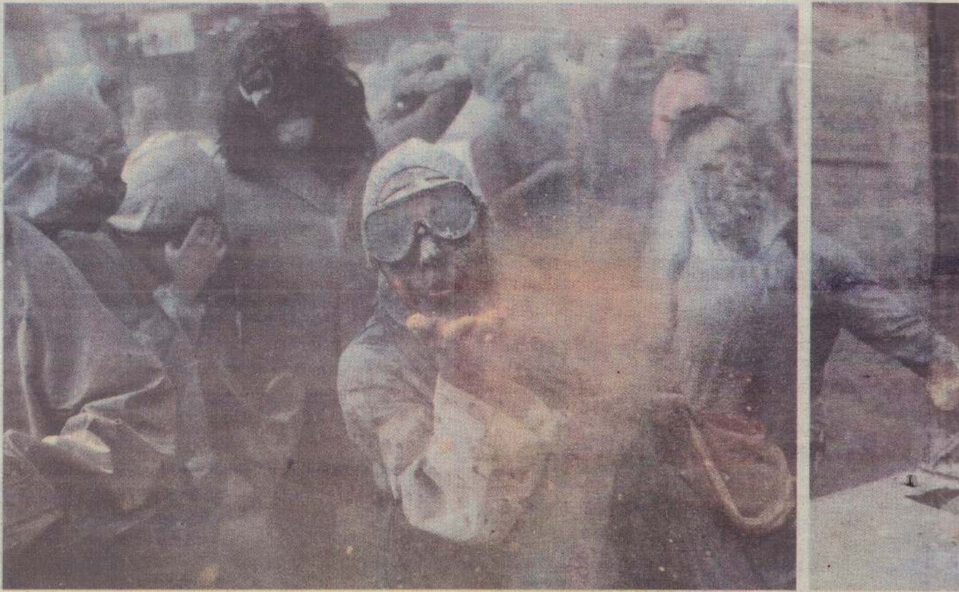
கிரீஸ் நாட்டின் துறைமுக நகரமான கலக்ஸ்டியில் வருடாவருடம் நடைபெறும் சாம்பல் திங்கள் விழா நேற்று முன்தினம் நடைபெற்றது. இந்த விழாவின் போது பல்லாயிரக்கணக்கான மக்கள் ஒன்றுகூடி, பலவாண மாவுகளை ஒருவர் மீது ஒருவர் எறிந்து தமது மகிழ்ச்சியை வெளிப்படுத்துவார்கள். மாவுப் போர் என்றும் இது அழைக்கப்படும். நடப்பு வருட விழாவின் போதும் பல்லாயிரக்கணக்கான மக்கள் ஆர்வத்துடன் கலந்துகொண்டனர். (ம)

பெற்று வருகின்றன. இந்த நிலையில் நாமைக் கொன்றவர் உன்னை என்று தென்கொரியா பகிரங்கமாக குற்றம் சுமத்தியது. இதற்காக 3 குழுக்களை தென்கொரிய அதிபர் கிம் ஜோங் உன் அமைத்திருந்தார். இரு குழுக்கள் நாமைக்கொல்வதற்கும் ஒரே குழு ஏனைய இரு குழுக்களுக்கு உதவி செய்வதற்கும் என அவற்றை அவர் நியமித்திருந்தார் என்று தென்கொரியா பகிரங்கமாகத் தெரிவித்துள்ளது. எனினும் இந்தத் தகவலை வடகொரியா மறுத்துள்ளது. முன்னதாக, கிம் ஜோங் நாம்கொலைவிவகாரத்தில் மலேசியாவுடன் இணைந்து கூட்டுவிசாரணைக்குத் தயார் என்று வடகொரியா தெரிவித்தமை குறிப்பிடத்தக்கது. (ம)