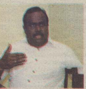
கைகள் மேற்கொள்ளப்படும் - என்றார். (10-10, 56)

இந்த விடயம் தொடர்பாக அமைச்சரின் கவனத்துக்குக் கொண்டு செல்லப்பட்டது. மன்னார் மாவட்டமும் கடுமையாக வறட்சியால் பாதிக்கப்பட்ட மாவட்டமாக காணப்படுவதை சுட்டிக்காட்டினேன். தற்போது மன்னார் மாவட்டமும் வறட்சி மாவட்டமாக பிரகடனப்படுத்தப்பட்டுள்ளது. ஏனைய மாவட்டங்களுக்கு வழங்கப்படுகின்ற வறட்சி நிவாரணங்கள் சமமான முறையில் மன்னார் மாவட்ட விவசாயிகளுக்கு வழங்க உரிய நடவடிக்கை