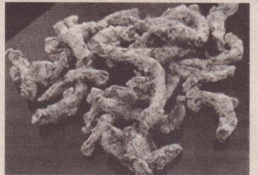
காய வைத்த பின்னர்