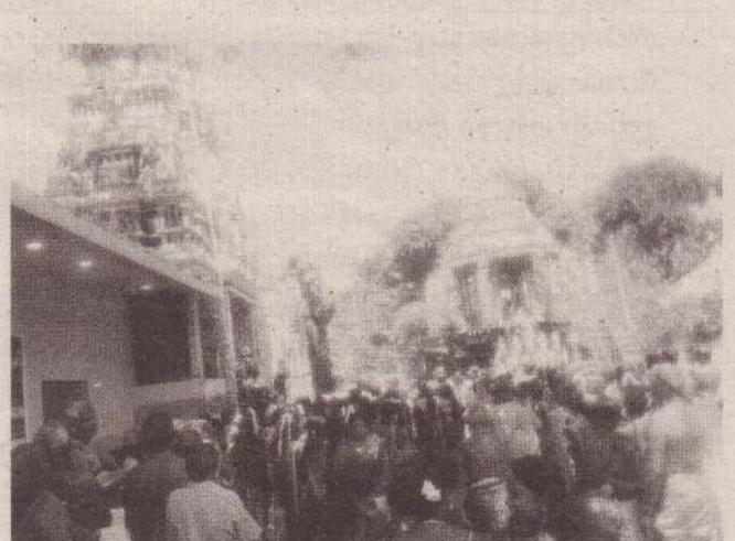
சாவகச்சேரி சங்கத்தானை ஸ்ரீமீனாட்சி அம்பாள், ஆலய தேர்த் திருவிழா நேற்று இடம்பெற்றது.