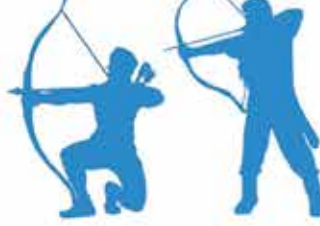
அம்பு எய்தல் Archery