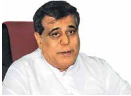
முதலாளிமார் சம்மேளனத்துக்கும் தொழிற்சங்கப் பிரதிநிதிகளுக்கும் இடையிலான பேச்சு

நாடாளுமன்றத்தில் நேற்று நடைபெற்ற விவாதத்தை நிறைவு செய்து உரையாற்றும் போது அவர் இது தொடர்பில் மேலும் தெரிவிக்கையில்,