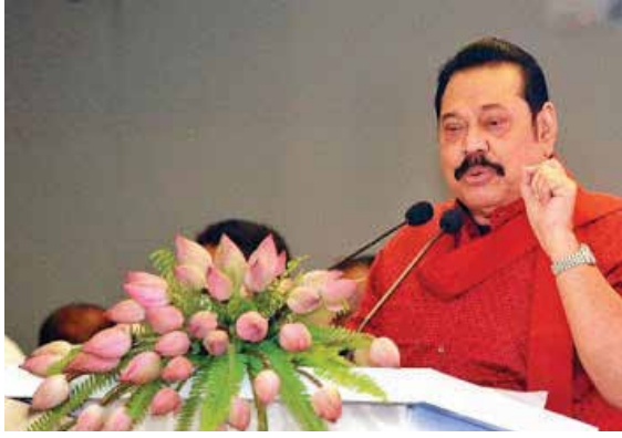
திசாநாயக்க எழுப்பிய கேள்விக்கு பதிலளித்த அவர், கொழும்பு துறைமுகம் நாட்டின் வளர்ச்சிக்கு

இந்தியாவின் வெளிவிசார அமைச்சர் ஜெய்சங்கர் கொழும்புக்கு இரு நாள் பயணமாக வந்துள்ள நிலையிலேயே இவ்வாறானதொரு நிலைப்பாடு அறிவிக்கப்பட்டுள்ளது. நாடாளுமன்றத்தில் அநுரகுமார