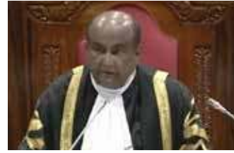
தமிழ்த் தேசியக் கூட்டமைப்பின் நாடாளுமன்ற