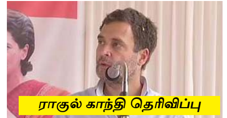
ராகுல் காந்தி தெரிவிப்பு

தொடர்ந்து போராட்டங்கள் நடத்தி கட்டாயப்படுத்தப்படாவிட்டால் இந்த 3 புதிய சட்டங்களை அவர்கள் திரும்பப் பெறப்போவதில்லை. இந்த 3 சட்டங்கள் இந்தியாவில் விவசாய முறையை அழிப்பதற்காக வடிவமைக்கப்பட்டுள்ளன.