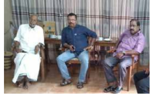
அமைப்புகளின் ஒற்றுமை தொடர்பில் நிறையவே எதிர்பார்ப்பை ஏற்படுத்தி விட்டிருந்தது.

இந்த அமைப்பின் உருவாக்கம் வடக்கு - கிழக்கு மக்களிடையே தீவிரவாத