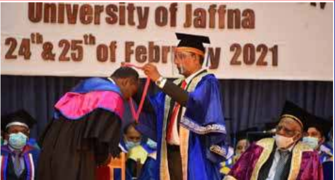
யாழ்ப்பாணம் பல்கலைக்கழக பட்டமளிப்பு விழா நேற்று யாழ்ப்பாணம் பல்கலைக்கழகத்தில் ஆரம்பமானது. (மேலும் படங்கள் 12ஆம் பக்கத்தில்)