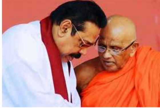
மஹிந்த இல்லா நாடு எமக்கு வேண்டாம் என மக்கள்

பிரதமர் அவர்களே! இந்த நாட்டை இவ்வாறு செல்ல அனுமதிக்க முடியாது. நீங்கள் கொஞ்சம் தலையீடு செய்யுங்கள். இன்று நாட்டு மக்கள் உங்களுடன்தான் இருக்கிறார். வேறு யாருடனும் இல்லை. யார் என்ன சொன்னாலும் மக்கள் உங்களுடனே இருக்கிறார்கள்.