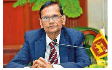
வியாழன் முதல் விடுமுறை வழங்கப் பட்டுள்ளமை குறிப்பிடத்தக்கது.

யாளம் காணப்பட்டால் அதற்கான மாற்று நடவடிக்கைகளை மேற்கொள்வதற்கான ஏற்பாடுகள் முன்னெடுக்கப்பட்டு வருகின்றன எனவும் குறிப்பிட்டுள்ளார். பரீட்சை நாட்களில் மாணவர்களுக்கு தேவையான போக்குவரத்து வசதிகளை ஏற்படுத்திக்கொடுப்பதற்கான பேச்சுக்கள் தற்சமயம் இடம்பெறுகின்றன எனவும் கல்வி அமைச்சர் கூறியுள்ளார். கல்வி பொதுத்தராதர சாதாரண தரப் பரீட்சையை நடத்துவதற்கு ஏதுவாக அனைத்து பாடசாலைகளுக்கும் கடந்த