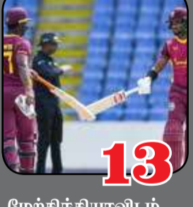
13 மேற்கிந்தியாவிடம் மண்டியிட்டது இலங்கை