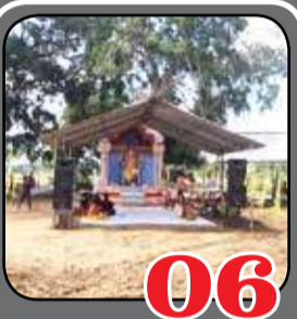
06 30 ஆண்டுகளின் பின் குருந்தாரமலையில் சிவராத்திரி