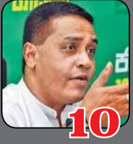
10 ஹிட்லரின் போக்கில் கோட்டா அரசு