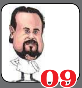
09 ரணிலை தய்ய வைக்க மைத்திரிக்கு சிறை