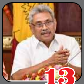
13 தீவிரவாத குற்றச்சாட்டுக் கைதாவோருக்கு புனர்வாழ்வு