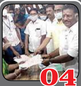
04 தமிழகத்தில் மீண்டும் அ.தி.மு.கவின் ஆட்சி