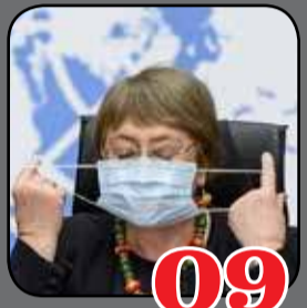
09 ஜெனீவா அரசியலில் ஈழத்தமிழர் 'அற'வியல்