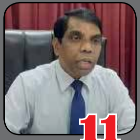
11 அயாய கட்டத்தில் யாழ்ப்பாணம் இதுவரை 400 பேருக்கு தொற்று