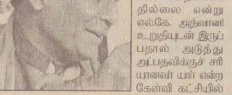
புதுடில்லி, ஜூன் 9 பா.ஜ.க. தலைவர் பதவியை ராஜ்நாத் செய்த முடிவைத் திரும்பப் பெறப்போவதில்லை என்று எஸ்கே. அத்வானி உறுதியுடன் இருப்பதால் அடுத்தது அப்பதவிக்குச் சரியானவர் யார் என்ற கேள்வி கட்சியில் எழுந்துள்ளது.

பார்க்கப்படுகிறது. தாக்கு இனத்தைச் சேர்ந்த ராஜ்நாத் சிங், சங்கப் பரிவார அமைப்புகளுக்கு ஆதரவாளர் மிக முக்கியமான மாநிலமான உத்தரப் பிரதேசத்தில் பிரபலமானவர். மேலும், அடுத்த தலைமுறைத் தலைவராக இருப்பதால் கட்சி தலைமைக்கு உகந்தவராகக் கூறப்படுகிறது. கட்சியின் முன்னாள் தலைவர்கள் எம். வெங்கையநாயுடு, முரளி மனோகர் ஜோஷி, கட்சியின் மாநிலங்களவைத் துணைத் தலைவர் சுஷ்மா ஸ்வராஜ், முன்னாள் மத்திய அமைச்சர்கள் அருண் ஜேட்லி, பிரமோத் மகாஜன் ஆகியோரின் பெயர்களும் கட்சித் தலைவர் பதவிக்குப் பரிசீலிக்கப்படுவதாக கூறப்படுகிறது.