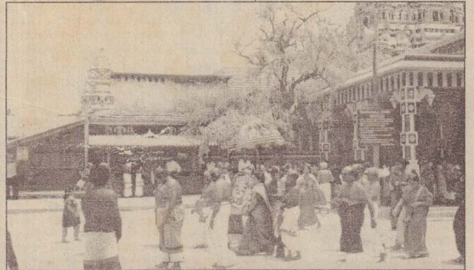
நயினை நாகபூசணி அம்மன் ஆலயத்தில் நேற்று அடம்பெற்ற கொடியேற்றத்தையடுத்து, அன்னை பூரணியின் திருவுருவப்படம் வீதி வழியாக எடுத்துவரப்பட்ட காட்சி. (மேல்: பக்தர்கள்)

பொதுக்கட்டமைப்பு யோசனையைக் கைவிடுவதாக அரசு அறிவிக்கும்வரை இந்த உண்ணாவிரதம் போராட்டம் தொடருமென தேசிய பிக்குமார் முன்னணி அறிவித்திருக்கிறது. (ஊ-க)