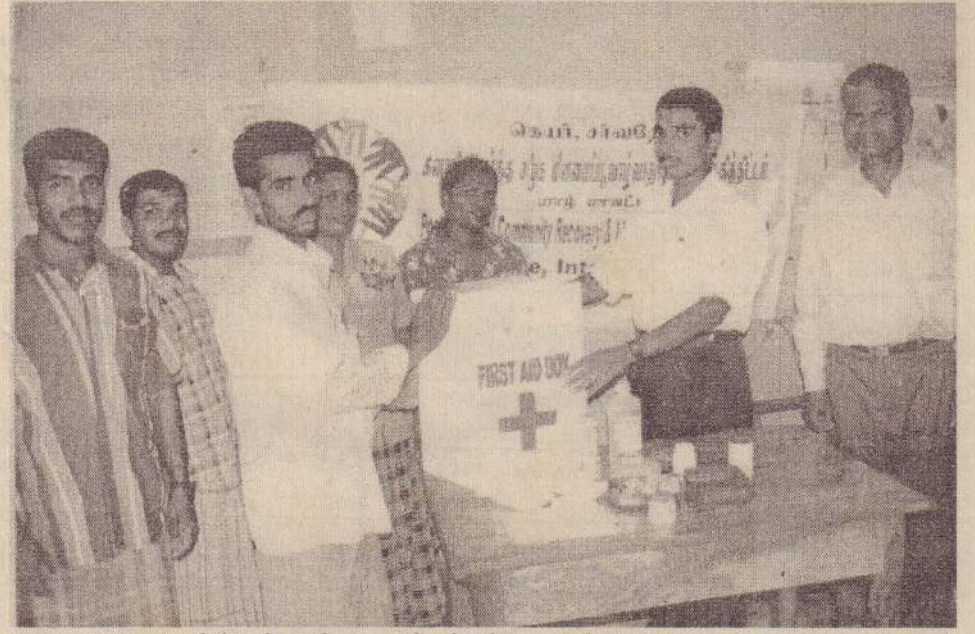
கனாமி அனார்த்தத்தால் பாதிக்கப்பட்ட கடற்றொழிலாளர் கூட்டுறவுச் சங்கங்களுக்கு முதல்தவீச் சீக்கிச்சைப் பெட்டிகளைச் சர்வதேச கெயர் நிறுவனம் வழங்கி வருகிறது. பருத்தித்துறை முனைக்கடற்றொழிலாளர் கூட்டுறவுச் சங்கத்துக்கென அதன் நிர்வாகிகளிடம் முதல்தவீச் சீக்கிச்சைப் பெட்டி ஒன்று கையளிக்கப்படுவதைப் படத்தில் காணலாம்.

தென்மராட்சி, ஜூன் 9 தென்மராட்சியில் செயற்படும் பலநோக்குக் கூட்டுறவுச் சங்கம் ஒன்றின் களஞ்சியத்திலிருந்து பாவனைக்குதவாத கோதுமை மா கண்டுபிடிக்கப்பட்டது. சாவகச்சேரி சுகாதாரத் திணைக்களத்தினரும் விலைக்கட்டுப்பாட்டு பிரிவினர் இணைந்து சமீபத்தில் நடத்திய திடீர் பரிசோதனையின் போது பாவனைக்குதவாத 100 முடைகள் கோதுமை மா சிக்கியது. இதன் பெறுமதி சுமார் ஒன்றரை