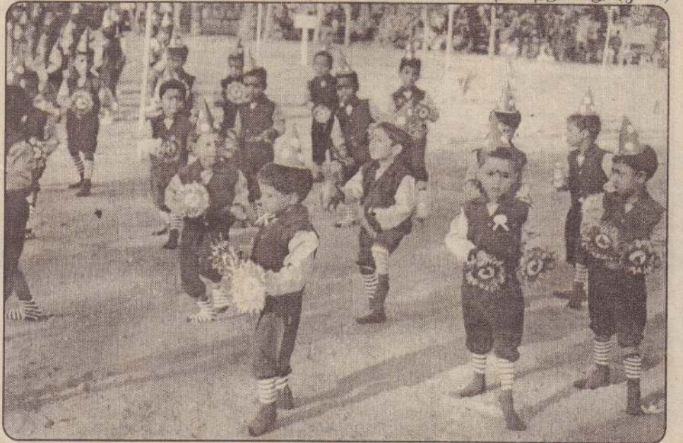
தமிழர் புனர்வாழ்வுக் கழக அலுவலகமையுடன் ஊரக வளர்ச்சிப்பணி நிர்வாகக்கும் சொக்கலிங்கம் சிறுவர் பூங்கா சிறார்களின் மெய்வன்மைப் போட்டி அண்மையில் நடைபெற்றது. பூங்கா சிறார்கள் கிசையும் அசையும் நிகழ்வில் பங்குகொள்வதைப் படத்தில் காணலாம்.

யாழ்ப்பாணம், ஜூன் 9 எதிர்வரும் ஜூலை மாதம் 15, 16, 17 ஆகிய திகதிகளில் கொழும்பில் நடைபெறவுள்ள தேசிய கனிஷ்ட பிரிவினருக்கு இடையிலான தடகளப் போட்டியில் கலந்து கொள்ள விரும்பும் வீரர்கள் நாளை வெள்ளிக்கிழமை மாலை 3 மணியளவில் யாழ். பொது விளையாட்டு மைதானத்தில் யாழ். மாவட்ட மெய்வன்மைச் சங்கச் செயலாளரிடம் தொடர்பு கொண்டு விண்ணப்பப் படிவங்களைப் பெற்றுக்கொள்ளலாம் என யாழ்.மாவட்ட மெய்வன்மைச் சங்கம் தெரிவித்துள்ளது. (ஏ-190)