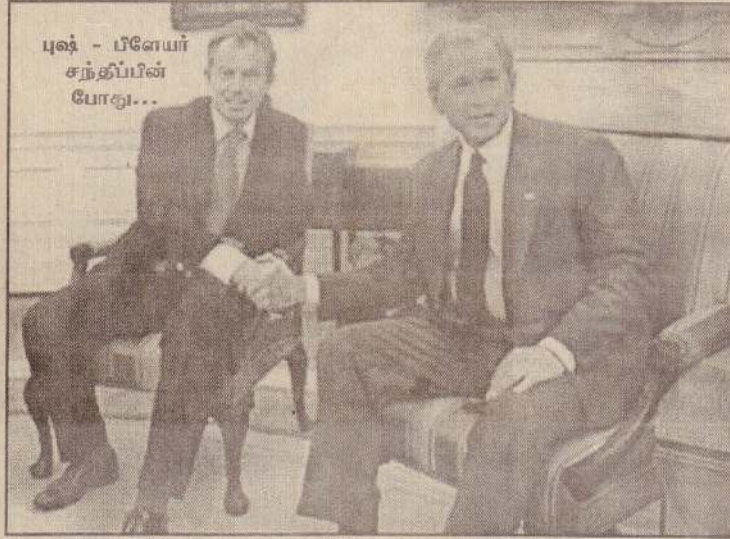
புஷ் - ப்ளேயர் சந்திப்பின் போது... ஒப்பந்தம் இறுதிக்கட்டத்தை அணுகித்துள்ளது. அமெரிக்க ஜனாதிபதி ஜோர்ஜ் பிள்யூஷ், பிரிட்லிஷ் பிரதமர் டொனிபிளேயர் ஆகியோர்

இதன்போது ஆபிரிக்காவின் வறுமையை ஒழிப்பதற்கு 60 கோடியே 74 லட்சம் அமெரிக்க டொலர்களை வழங்க தான் தயாராக இருப்பதாகப் புஷ் தெரிவித்தார். இதில் 40 கோடியே 14 லட்சம் அமெரிக்க டொலர்கள் எதிர்ப்பாட்டி, எந்திரிய ஆசிய நாடுகளின் மனிதாபிமான அவசர உதவிகளுக்காக பட்டினியை ஒழிக்கும் வகையில் செலவிடப்படவுள்ளது எனப் புஷ் தெரிவித்தார்.